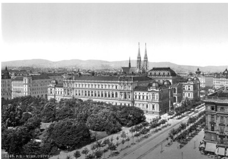
Ringstrasse před dokončením