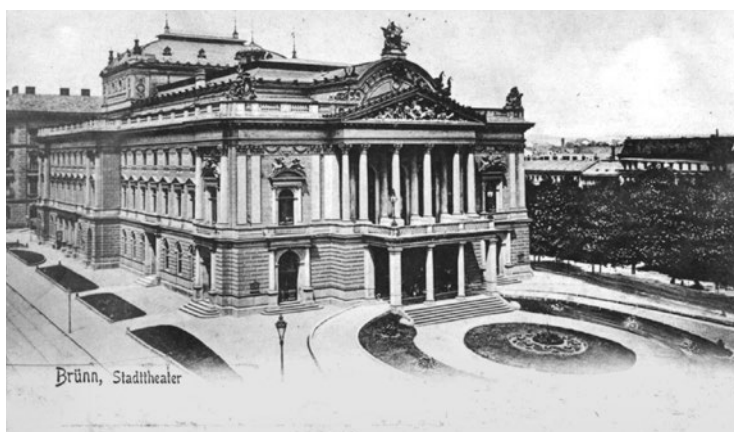
Městské divadlo Na hradbách (dnešní Mahenovo divadlo) v Brně, 1905

ve „třpytivých zlatých mincích a zaručovala tím svou stabilitu“. 7 Rodiče ukládali svým dětem úspory už jako miminkům v kolébce, protože věděli, že peníze jim zaručí dobrou budoucnost. Státnímu úředníkovi stačilo nahlédnout do kalendáře, aby věděl, kdy bude povýšen a kdy bude moci odejít do důchodu se zajištěnou penzí. „Vše v této velké říši stálo pevně a nezměnitelně na svém místě a na tom nejvyšším staříčkový císař; kdyby však zemřel, pak se vědělo (či mělo za to), že přijde jiný a v dobře propočteném pořádku se nic nezmění. [...] Vše radikální, vše násilné se už zdálo být ve věku rozumu nemožným.“ 8