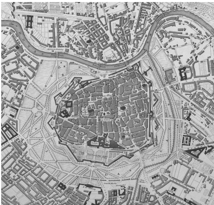
Vídeňské středověké hradby a valy