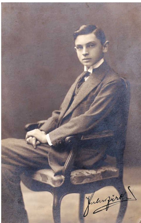
Julek své vzdělávání ukončil v kvartě.