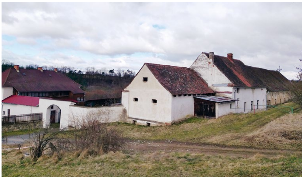
Rodný statek bratří Firtů v Sestrouni u Sedlčan (stav 2024).