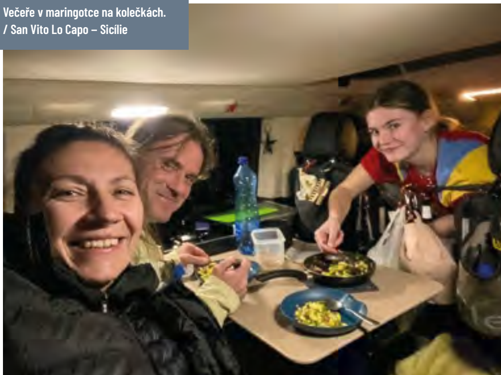
Večeře v maríngotce na kolečkách. / San Vito Lo Capo – Sicílie

Rok uplynul jako voda a Mára plánoval další expedici. Jakmile odjel za svým snem, což jsem mu přála, začaly chodit lítostivé SMS, jak se mu stýská a že na nás pořád myslí, že by chtěl mít u sebe svoji holčičku. Skoro to vypadalo, že štěstí, které prožíval dříve, když odjel na expedici, nebylo tak šťastné. A to i přes to, že z něj spadly všechny domácí povinnosti, nebo spíš právě proto. Pro mě se štěstí, které se mě dříve dotklo po jeho odjezdu na expedici, změnilo v pravé peklo. Začala jsem pracovat na částečný úvazek ve svém původním zaměstnání, abychom udrželi rodinný rozpočet. A zbyla na mě i péče o roční dítě, starost o psa a část pracovních povinností Máry. Spala jsem minimálně a neodpočívala vůbec. Nezbyval ani čas na přemýšlení, jak se asi daří Márovi. Do toho mi co chvíli dorazila zpráva, jak se mu stýská a jak by už chtěl být zpět doma. Nechtělo