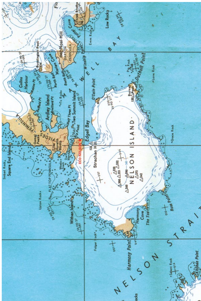
Mapa ostrova Nelson, kde ležela naše základna.