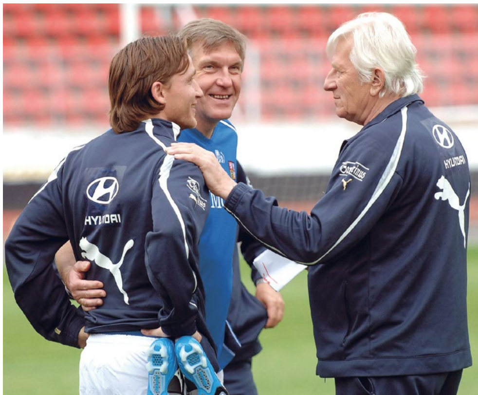
Karel Brückner mi dával před mistrovstvím světa velkorysou nabídku. Nemohl jsem ji ale přijmout.

„Sen se mi zhroutil, další šance už nepříjde,“ řekl jsem jim. „Ale budu vám alespoň držet palce, abyste udělali co nejlepší výsledek.“