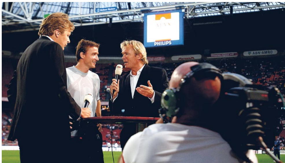
Na Ajaxu se mě před prvním zápasem předkola Champions League ptali, jak to vidím. A já je svou odpovědí šokoval...

hrál několikrát a odnesl si dobré vzpomínky. Počítal jsem s tím, že Ajax bude chtít hrát fotbal a nenarazíme na důrazný styl. Ano, měl hodně silný tým, hvězdy jako Klaase-Jana Huntelaara nebo Luise Suáreze, naproti tomu my jsme neměli co ztratit a role outsiderů nám sedla dokonale.