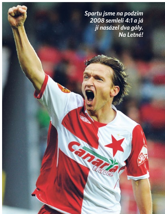
Spartu jsme na podzim 2008 semleli 4:1 a já jí nasázel dva góly. Na Letné!