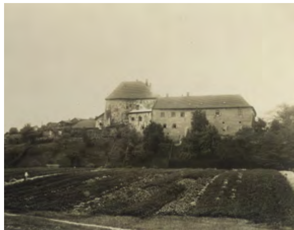
Vyobrezání slezskoostrovského zámku, 20. léta 20. století