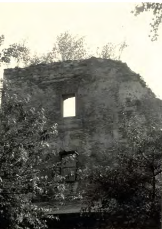
Pozůstatky zdiva hradu v 60. letech 20. století

získalo do svého majetku. Po nezbytné rekonstrukci byl hrad v květnu 2004 zpřístupněn veřejnosti. Do dnešní doby se z původního hradu zachovala pouze zřícenina části hradního paláce, malá část hradebního opevnění a vstupní renesanční brána s věží. Ze zámku se nedochovala žádná stavba. V současnosti zámek slouží zejména kulturním a společenským akcím. Ty se ale odehrávají v kulisách betonu a kamení, které se na první pohled mohou tvářit jako starý hrad. Druhý pohled jasně deklaruje, že Slezskoostravský hrad je