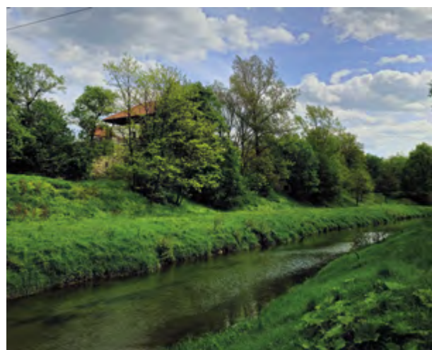
Identický pohled od Lučiny na jaře 2024