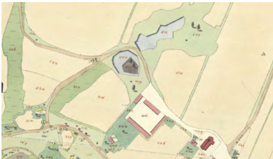
Centrum Staré Bělé s rybníčkem a tvrzištěm uprostřed na mapě stabilního katastru z roku 1833