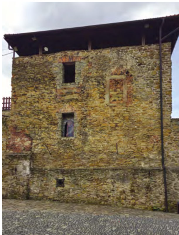
Zachovalá část původního zdiva zakomponovaná do nynější podoby hradu, 2024

Moravská Ostrava, připomínaná poprvé roku 1267 v listině olomouckého biskupa Bruna ze Schauenburku, byla patrně hospodářsky propojena s hradem na Landeku. Biskupské město se brzy stalo sídlem správy severomoravských biskupských držav, hospodářským střediskem celého moravskoostravského