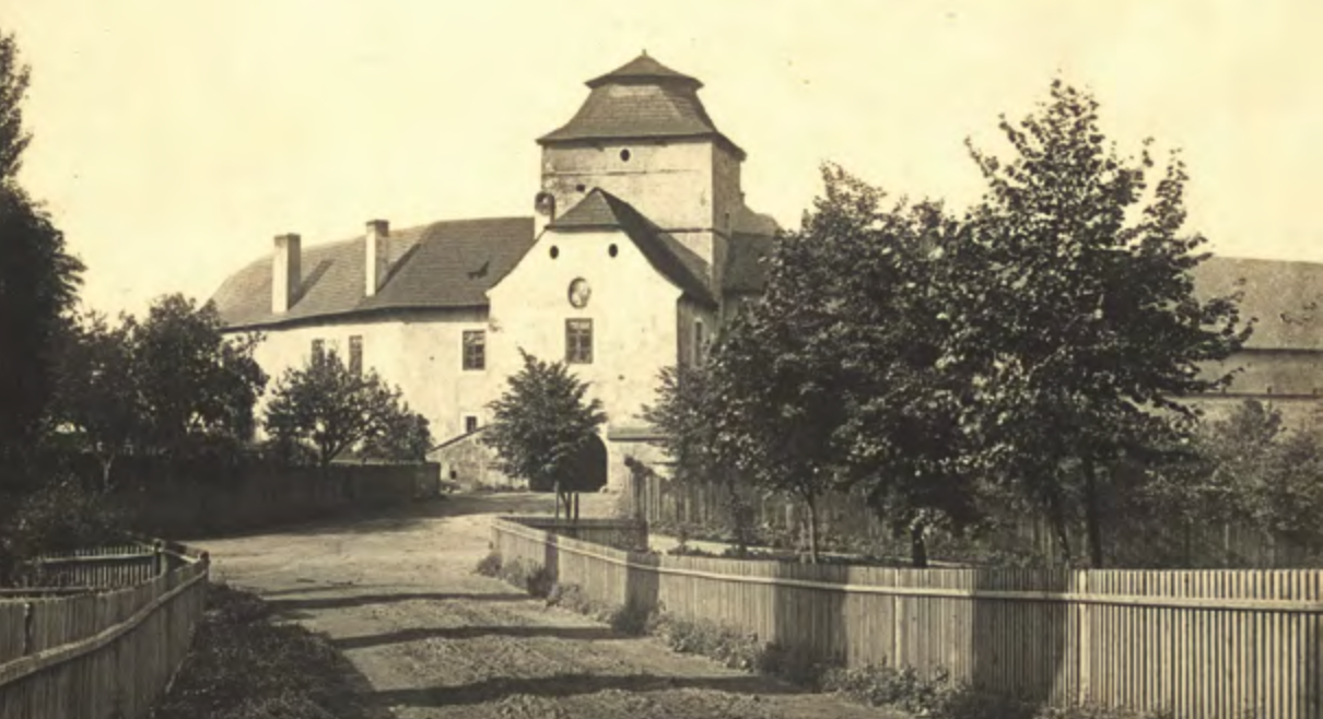
Záběry s vyobrazením Slezskostravského zámku, 20. léta 20. století

s jeho opravami, současně však byl zjištěn pokles stávajících budov o 8–11 m následkem poddolování.