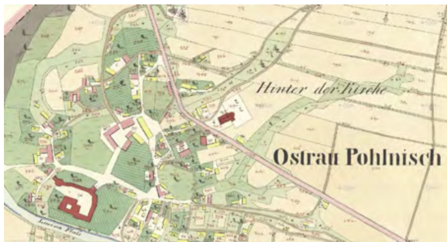
Slezskoostravský zámek s předzámčím, stabilní katastr, třetina 19. století

1787 zahájil František Josef hrabě Wilczek jeho pravidelnou těžbu. Ta se brzy projevila poškozením zámeckých budov. Wilczkové obohatili zámek pouze o klasicistní přestavbu severní věže.