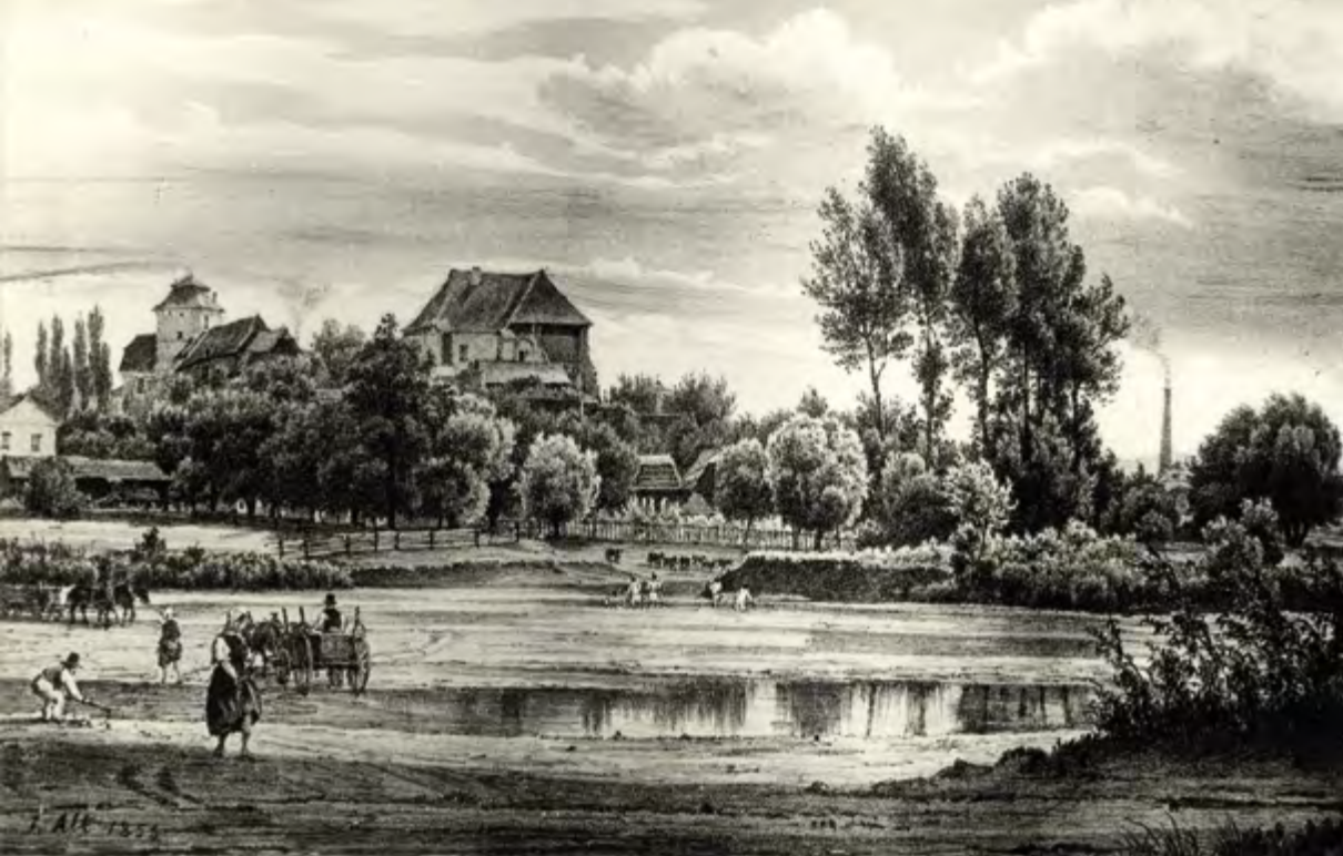
Slezskoostrovský zámek, tehdy ještě na kopci, na kresbě Jakoba Alta v roce 1855, pohled od Moravské Ostravy

Podle dochované zprávy z roku 1804 byl zámek téměř pustý.