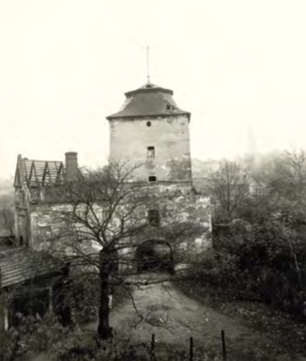
Jedna z mála dochovaných staveb renesančního zámku – vstupní brána, snímek ze 40. let 20. století

zámku a ostatního majetku Wilczků na základě znárodnovacích dekretů československý stát. Zřícenina zámku byla až do roku 1958 svěřena do majetku dolu Trojice, následně zámek převzal Obvodní národní výbor ve Slezské Ostravě. Dolování pod zámek pokračovalo až do počátku 60. let 20. století. Hrad v důsledku těžby poklesl o konečných 16 m.