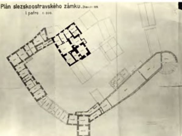
Půdorysy přízemí a prvního patra zámku v roce 1919

1844 musel být zbourán rytířský sál s žebrovou klenbou a zámek postupně nabýval vzhledu zříceniny. Na místě sálu byl zbudován pivovar. Dne 30. listopadu 1872 zámek postihl další rozsáhlý požár. Teprve pak se začalo