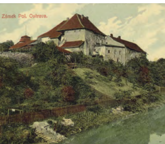
Pohlednice s vyobrazením hradu od Lučiny, okolo 1920

na fakt, že se nevědělo, do jaké míry hrad ještě poklesne. Roku 1940 zasáhla okolí hradu povodeň. Devastaci zámku podpořilo také letecké bombardování Ostravy dne 17. listopadu 1944. Bomby dopadly v těsné blízkosti zámku a narušily jeho zbývající část. Po osvobození v roce 1945 převzal správu