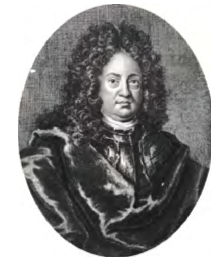
Jindřich Vilém Wilczek (17. září 1665 – 19. března 1739), rakouský diplomat a vojevůdce (polní maršál) z českého šlechtického rodu Wilczků (Vlčků)

Roku 1714 koupil zámek s polskoostravským panstvím známý rakouský vojevůdce a diplomat, hrabě Jindřich Vilém Wilczek. Roku 1763 bylo ve Slezské Ostravě objeveno uhlí a v roce