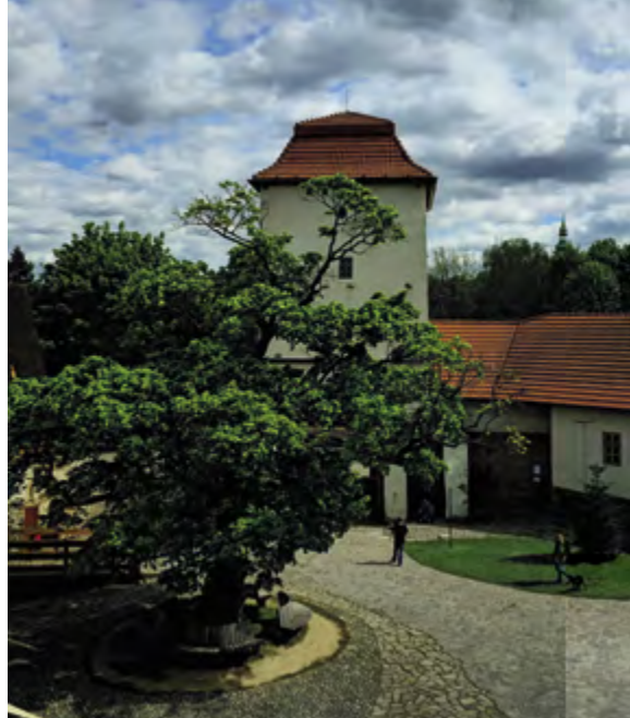
Pohled na bránu na jaře 2024

Stav památky dospěl dokonce tak daleko, že na ní byl vydán 15. února 1954 demoliční výměr. Hrad od konce 70. let procházel nevhodnými úpravami bez dohledu památkářů. Zbylé ruiny byly znehodnoceny. Na místě někdejší gotické bašty, jež byla smetena bagrem, začala nejdřív vyrůstat