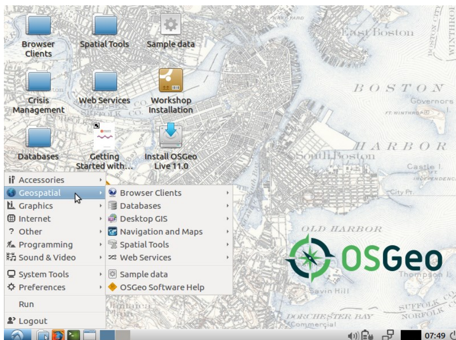
Obrázek 3: Prostředí linuxové distribuce OSGeo–Live