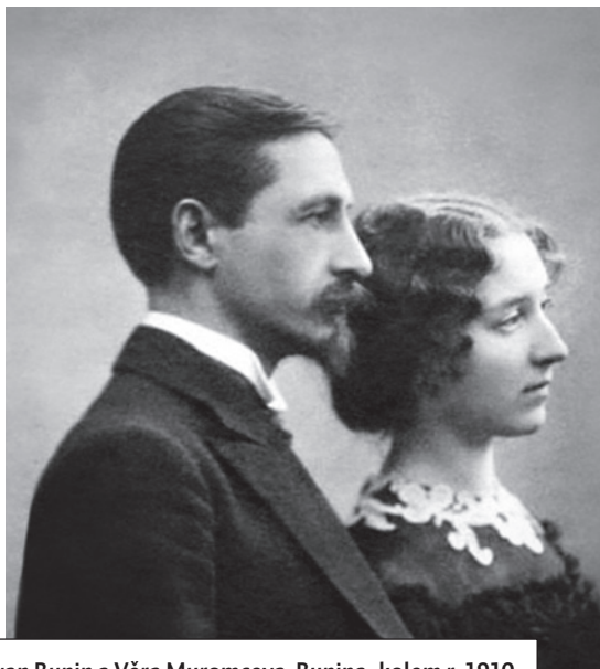
[1] Ivan Bunin a Věra Muromceva-Bunina, kolem r. 1910

Takto popisují Ivan Bunin a Věra Muromceva-Bunina [1] hygienická opatření, jimiž museli projít ruští emigranti, kteří uprchli z Oděsy na začátku roku 1920, těsně před dobytím města Rudou armádou. Právě zdravotním kontrolám, které byly pro mnohé uprchlíky zahájením jejich pobytu v exilu, se budeme věnovat v následujících odstavcích. O opatřeních píše uprchlíci bezprostředně v denících nebo také v pamětech, které vznikly až dlouho po popisovaných událostech. V zápiscích vyjadřují