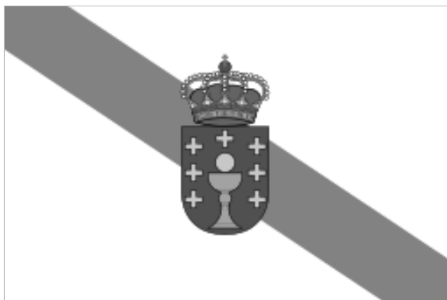
Obr. 1: Galicijská vlajka

Současná galicijská vlajka vznikla na konci 19. století v rámci galicijského národního obrození ( Rexurdimento de Galicia ) a byla zavedena generací Nós (My) jako symbol galicijského národa. Má podobu obdélníku s bílým pozadím a modrou úhlopříčkou směřující od levého horního rohu do pravého rohu dolního. Uprostřed úhlopříčky je galicijský znak.