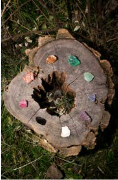
Přírodně zbarvené kameny