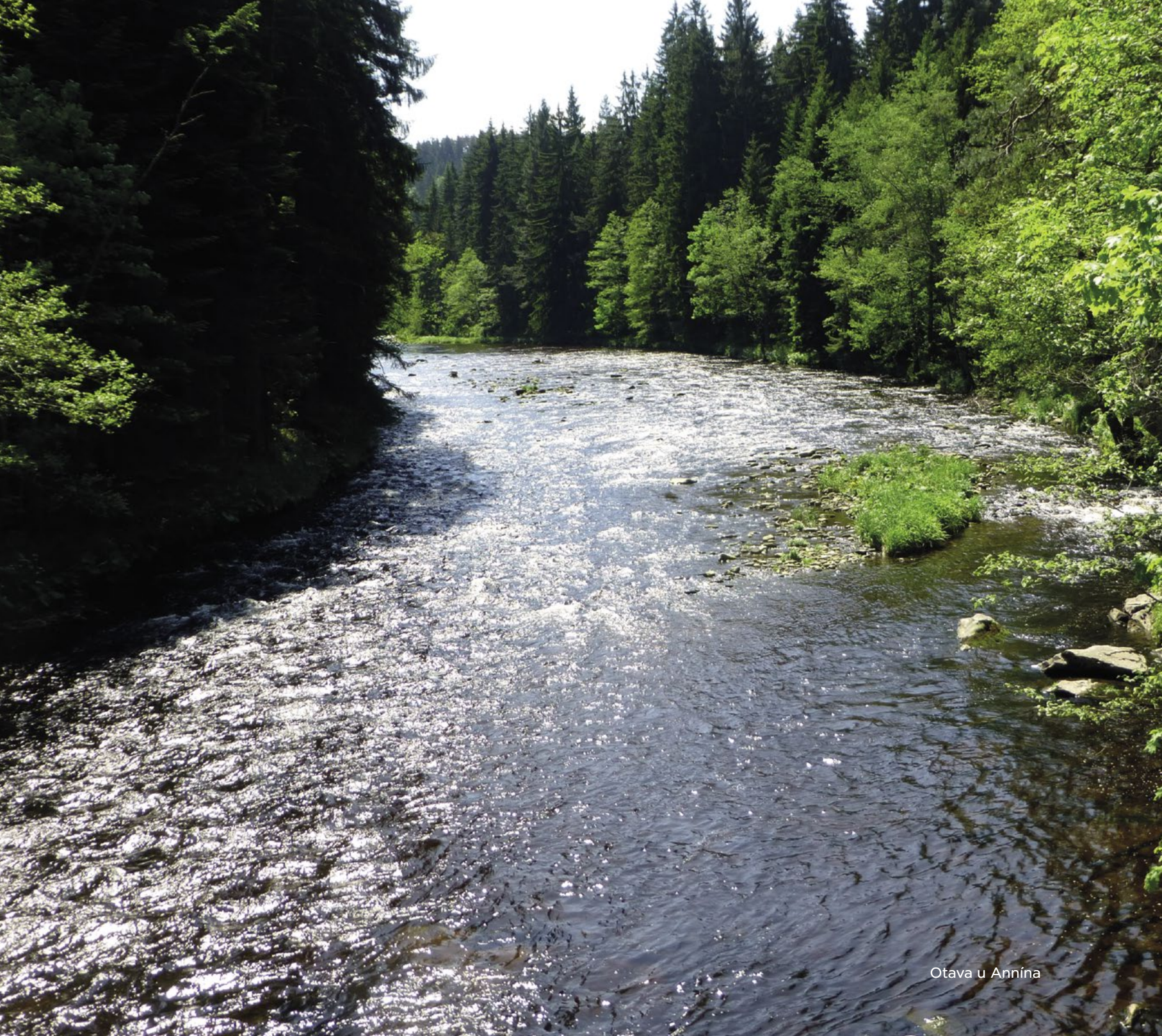
Otava u Annína