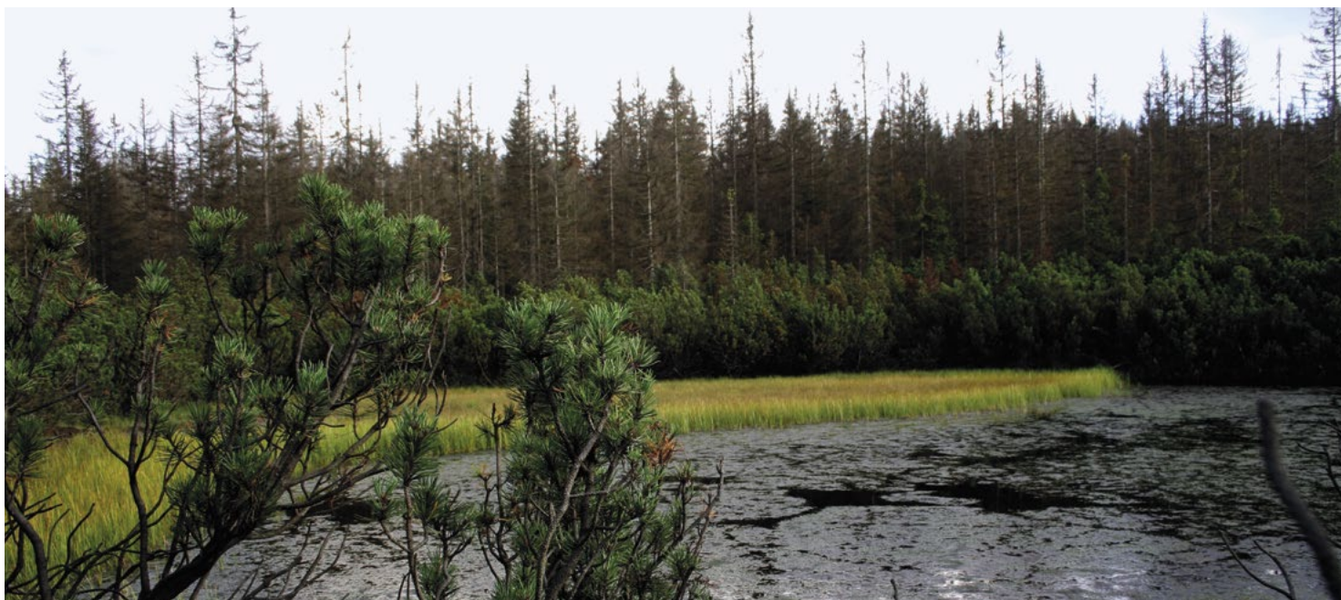
Nostalgická krása šumavských slatí

Šumava poskytla inspiraci k vytvoření zřejmě největší a taky nejdražší české knihy. Je jí Šumava umírající a romantická všestranného umělce Josefa Váchala. Ne, že bych chtěl její kvalitu poměřovat podle váhy a rozměrů, ale je bezesporu zajímavé, že váží dvacet kilogramů a měří 65 × 49 centimetrů. Před deseti lety se vydral její originální exemplář za tři miliony jedno sto tisíc korun. Její novodobé vydání v luxusním provedení se dnes nabízí i za padesát tisíc. Jiná kniha, která se věnuje fenoménu sklárny Lötz z Klášterského Mlýna (asi nejslavnější šumavské sklárny, která v období secese dosáhla i světové proslulosti), soustředila její sklářské stříhy z let 1900–1914 a čítá devět set stran. A další obří kniha nazvaná prostě Šumava nabízí čtenářům osm set stran čtení a předpokládá, že mají dostatečně silné ruce. Váží totiž pět kilogramů.