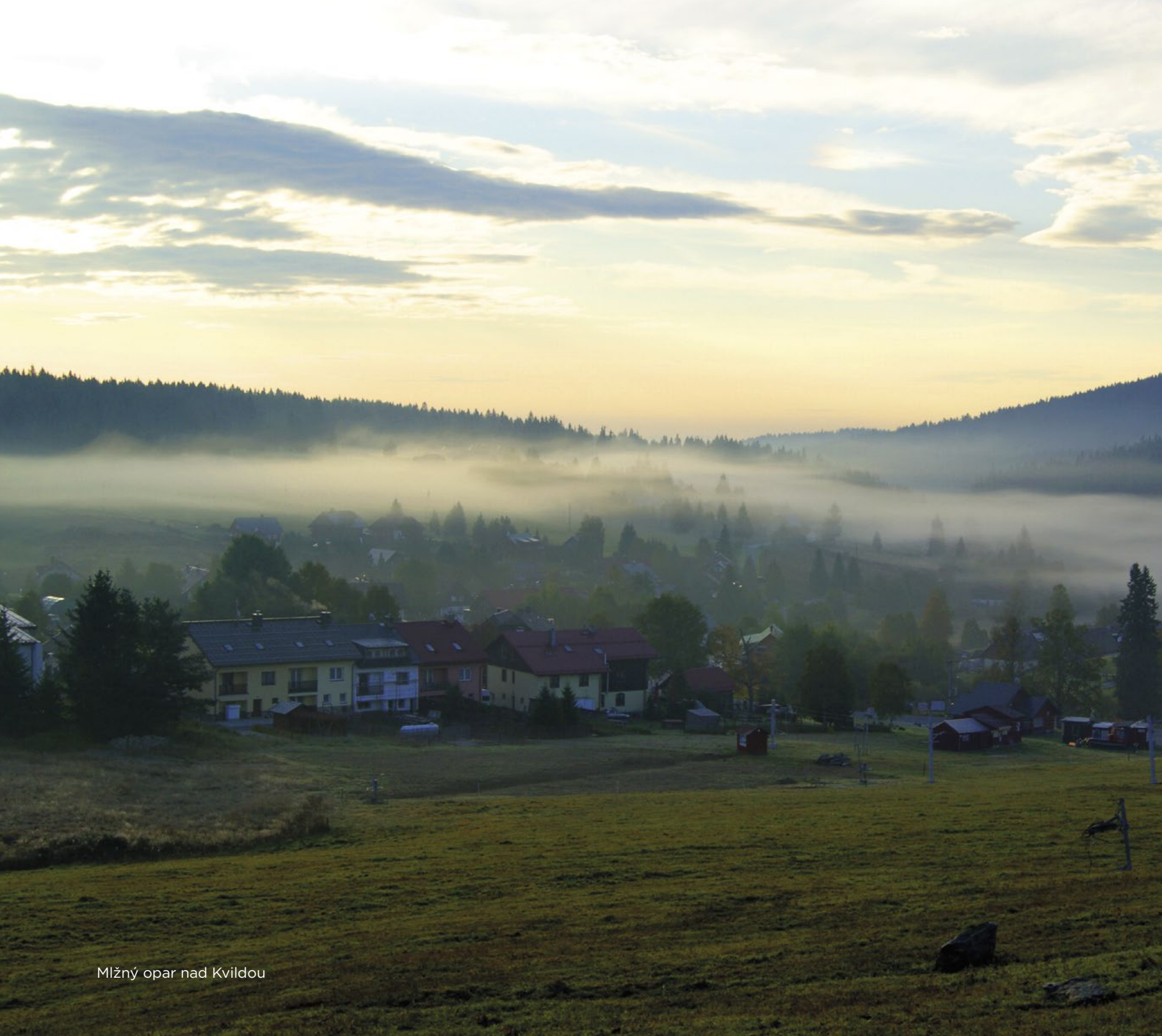
Mlžný opar nad Kvildou