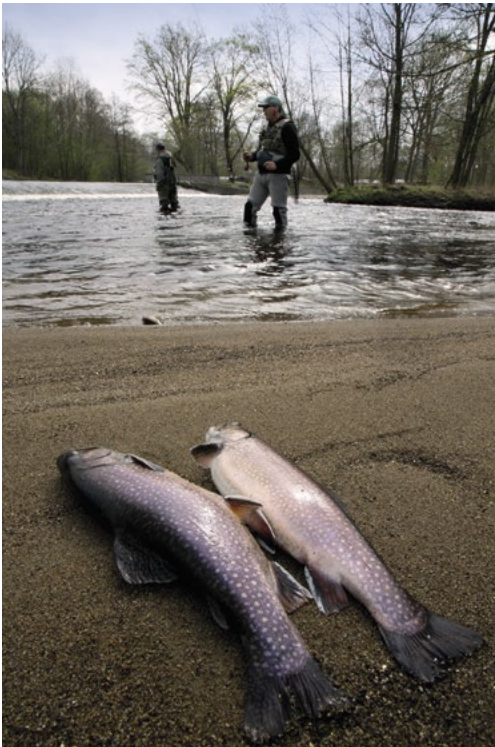
Kapitální otavští siveni

Pstruzi a lipani ale mizeli z Otavy i jinak. Například v roce 1969 proplácho Solo Otavu hned dvakrát smrtícími chemickými koktejly. Nejprve z továrny unikl amoniak, aby nedlouho nato dodělal dílo zkázy fenol, který se používal v závodě Sola v Dlouhé Vsi při výrobě záchodových prkének z lisovaného dřeva. Podle pamětníků byla právě tahle otrava tím nejhorším, co Otavu v novodobé historii postihlo. Pamatuji se, jak jsem jako jedenáctiletý klučina šel podél břehů řeky a nemohl uvěřit svým očím. Po obou březích se táhl koberec uhynulých ryb. Byly jich tisíce. Malé, velké, pstruzi, lipani leželi vyrovnáni na trávě, na kterou je uložila voda jako na nějaký přírodní katafalk, a připomínali trofeje nějakého šíleného lovu, který neměl konce. V očích jsem měl slzy a můj úžas nebral konce stejně jako nekonečná řada rybích těl, které zvolna ztrácely svůj lesk a svoji krásu. O čtyři roky později