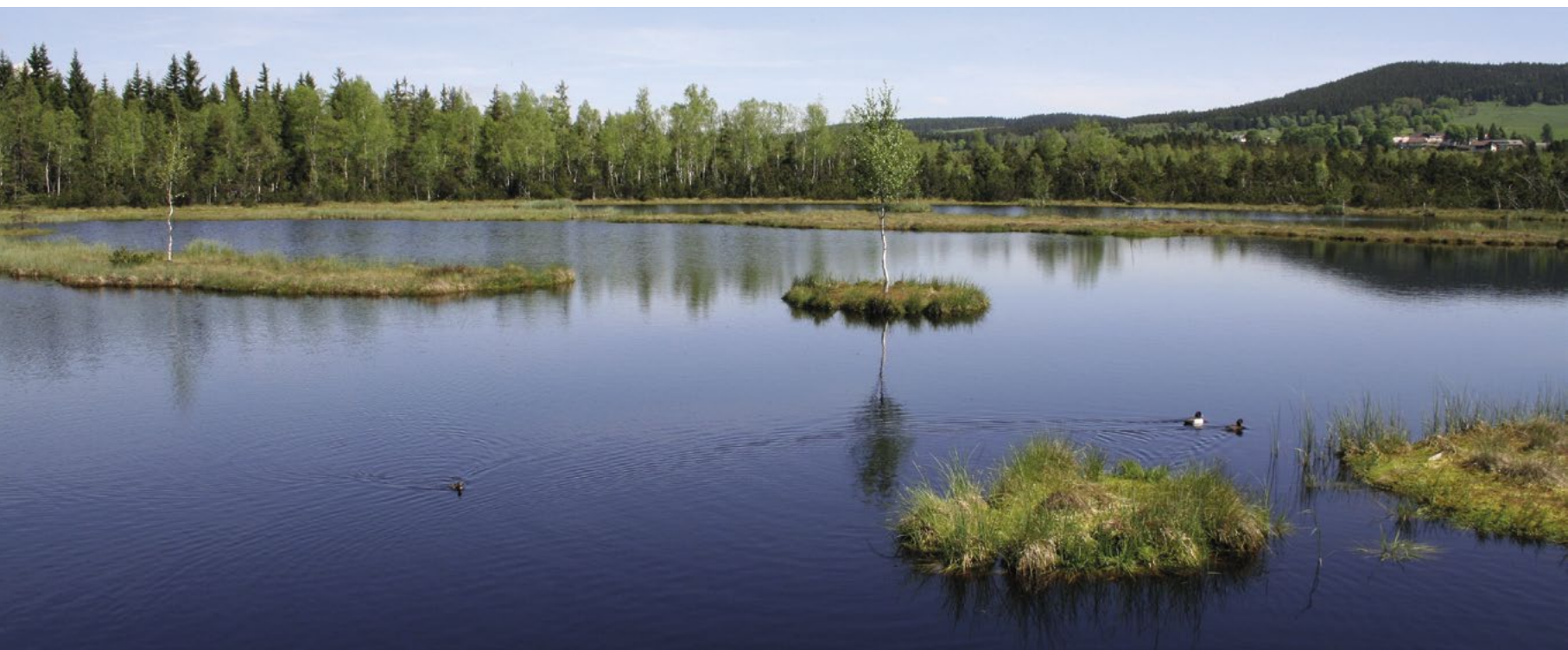
Chalupská slať s ostrůvky

Pro mě má největší kouzlo Šumava časného jara. Rozličné stromy nabízejí oku různé tóny zeleně. U potoků svítí zářivými barvami petrklíče, blatouchy, sasanky, měkčí barvy nabízejí podléšky. Paleta jarních barev je nepřeborná. Mimochodem popisu barev si užíval i Karel Klostermann. Autor jedné studie spočítal, že nejvíce různých barev na jedné straně Klostermannova textu, konkrétně třináct, se nachází v románu V ráji šumavském . A asi nepřekvapí, že k líčení těžkého, až pochmurného života na Šumavě a její přírody používal nejčastěji barvu černou: „černé, smutné klečiny“, „černých melancholických lesích“, „černé tůně“, „černý šátek“, „černého chleba“. Celkem použil ve svých