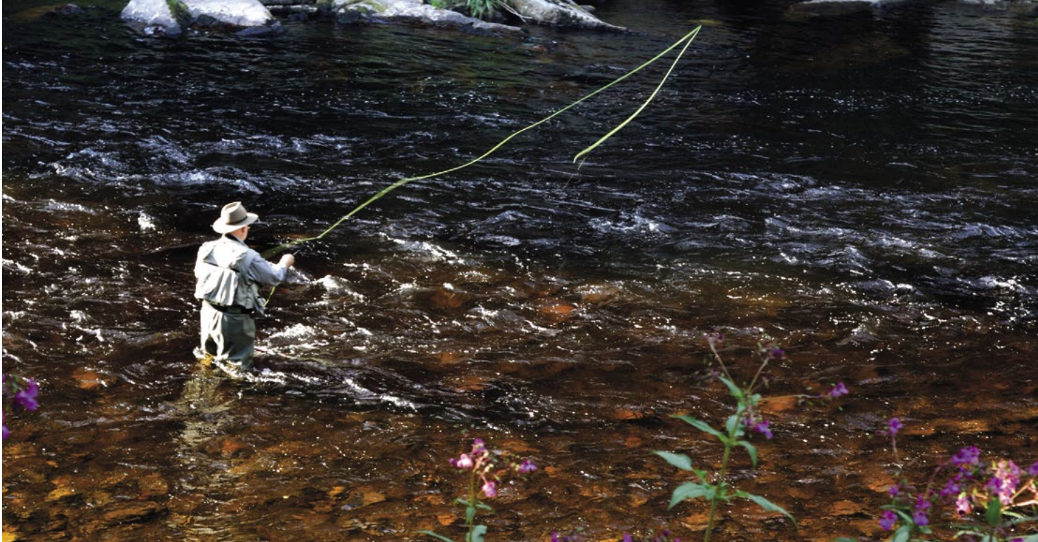
Muškaření na Otavě

Naše šumavské toulání začneme trochu volněji. Nebudeme se totiž věnovat jedinému zcela konkrétnímu místu, ale projdeme se kolem jedné z dominant střední Šumavy i Pošumaví – Otavy. A v ruce budeme držet rybářský prut. Snad každý malý kluk, který vyrůstal v Sušici, se tak či onak potkal s Otavou. Já tedy docela intenzivně. V zimě jsme hráli hokej na zamrzlé řece nad jezem v samém středu města, zatímco v létě jsme se vrhali do zpěněné vodní masy pod ním. Největším dobrodružstvím bývalo, když se přinesla klika od propusti, kterou kdysi proplouvaly vory. Sklopili jsme železnou zábranu, pozorovali valící se proud a ti odvážnější jej zkusili kraulem překonat. Propust tehdy disponovala ještě fungujícím semaforem, který jsme nastavili na „volno“, kdyby snad někdo chtěl využít otevřené propusti a proplout jí. Čekali jsme sice marně, ale bavili se náramně.