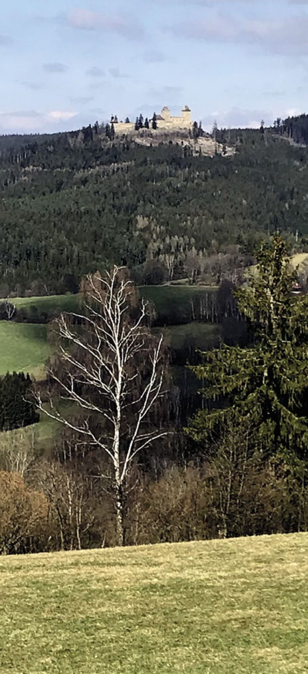
Kašperk – nejmýše položený hrad v Čechách

v Pražském Sušičanu a v řadě měst a obcí jsem pravidelně dostával zdánlivě jednoduchou otázku: „Které místo na Šumavě máte nejraději?“ Přestože to- muto pohoří věnuji každou volnou chvíli, courám po něm nějakých víc než pět desítek let, když jsem poprvé dostal tenhle až triviální dotaz, zjistil jsem, že na něj neumím odpovědět. Nebyl jsem schopen uvést to jediné konkrétní místo, které by pro mě bylo ze všech nej nej nej. A tak se tazatel musel spo- kjit s odpovědí, kterou jsem ze sebe vysoukal, že takhle se to říct nedá, že těch míst je víc. A protože stejný dotaz se dal očekávat i v budoucnu, udělal jsem si domácí úkol, jak to s těmi oblíbenými místy vlastně mám.