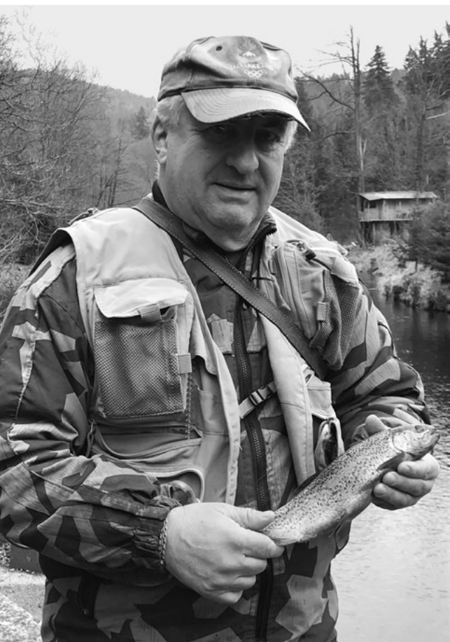
Autor s úlovkem

Jak jsem psal, rybařit vláčením – tedy na třpytku nebo něco podobného – moc nemusím. Ale zjara, když volání řeky je už silné a na suchou mušku se ještě chytat nedá, překonám svoji muškařskou hrdost a vydám se k řece s vláčecím prutem. Stojím ve vodě a házím „gumu“ (twister) před sebe. Nic se neděje, ale jsem u vody, a to je fajn. Najednou zůstanu viset. To znamená, že návnada uvízla za kamenem, zachytila se za vodní rostliny nebo potopený kus dřeva. Inu, je třeba ji vyprostit. Snažíte se ji tahat prutem do všech stran, abyste našli pravý úhel, kdy sevření povolí. Doleva – nic. Doprava – nic. Nahoru – nic. Návnada drží pevně. Nezbyvá než se k ní vydat, a protože se nalézá v hlubší vodě, doufat, že se jí podaří uvolnit po paměti botou. Udělám dva kroky, sleduji, kam vede vlasec. Najednou se návnada uvolní, ale ne sama od sebe – vězí v obrovském pstruhovi, který se konečně rozhoupal k pohybu. Vyvalí se na hladině a já v něm poznávám duháka. Do Otavy se totiž občas vysazují velké ryby – generačky –, které v líhních sloužily k vytírání nových rybích generací. Když se jejich čas naplní, jdou do řeky, „aby si rybáři užili pořádné ryby“, měří totiž hodně přes půl metru, až třeba kolem 80 centimetrů. A jedna taková mně visela na prutu. Bohužel asi jen půl minuty. Má snaha osvobodit návnadu přinesla ovoce právě teď. Guma vylétla z rybí tlamy, prut se narovnal a po pstruhovi zbyla jen vlnka na hladině. Byl nenávratně pryč.