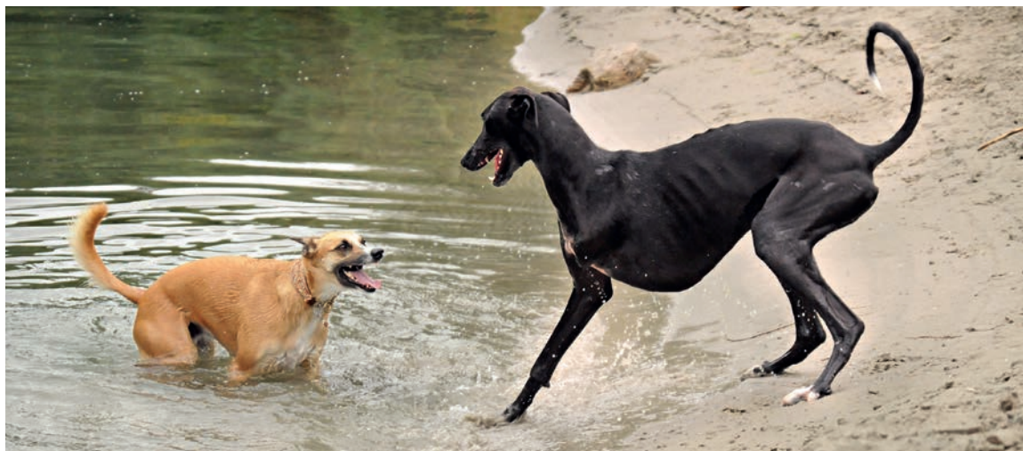
Rubena ani nenapadlo, že by ho chybějící noha mohla omezovat.

nového psa v domě více soustředit, místo aby zjišťoval všechny lékařské možnosti.) Měli byste si dobře promyslet, jestli si budete vědět rady. Pokud například bydlíte v přízemí, není problém ujmout se třínohého psa nebo psa s těžkou artrózou a/nebo DKK (dysplazií kyčelních kloubů). Pokud však bydlíte v domě se strmými schody, je to prakticky nemožné pro psa, který nemá přední nohu (chybějící zadní noha by v tomto případě nebyla tak velký problém), nebo pro toho, který kvůli artróze při sestupu hodně trpí. Samozřejmě že handicapovaný pes potřebuje domov stejně jako zdravý pes. Ovšem měli bychom si uvědomit, že některé handicapy potřebují péči i léky po celý život, pravidelnou kontrolu veterináře a v případě potřeby fyzioterapii nebo někdy i následnou operaci. Můžete si to dovořit? Pokud ne, je to skutečnost, které byste se měli postavit. Není nic smutnějšího, než když nejsme schopni poskytnout potřebnou péči psovi, za něhož jsme zodpovědní.