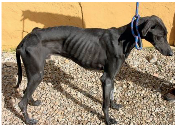
Když španělský myslivec donesl Nana do útulku, vypadal žalostně.

Pes, který byl předán do útulku, možná přišel o domov, protože jeho majitel zemřel, skončil v nemocnici či ve vězení, protože mělo dítě silnou alergii nebo na něj kvůli životním změnám neměli majitelé čas. Je odloučen od těch, které znal, jimž důvěřoval nebo minimálně od života, který dobře znal. Čeká na to, že bude opět všechno tak, jak bylo, hledá pachy, které jsou mu povědomé a díky nimž by se mohl zase cítit dobře. Když jde o pouličního tuláka, psa, kterého drželi na řetězu, galga