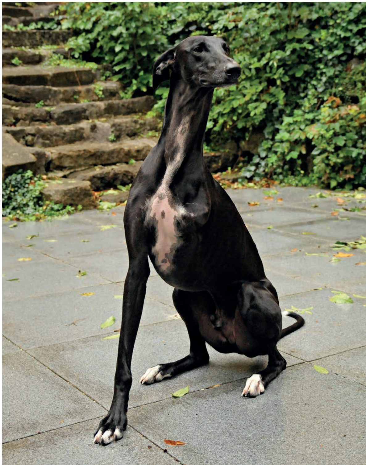
Fotografie psa, kterému také chybí noha.