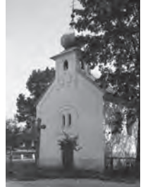
Kaple sv. Vendelína v Arnolci