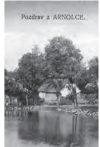
Pohled z Arnolce z roku 1928

V roce 1917 měl být pro válečné účely zrekvírován a roztaven větší, devadesátikilogramový zvon z arnolecké kaple sv. Vendelína.