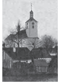
Farní kostel ve Zhoři

Můžeme se pouze dohadovat, co všechno rezonovalo v duši mladého arnoleckého kluka, jehož obzor končil věží monumentálního polenského chrámu: první světová válka, dřina na polích, obecní pospolitost, nedělní cesty do zhořského chrámu. Lidí se nestranil a patřil k „tmelům“ arnolecké mládeže. Ale co nebylo zrovna typické – jako chlapec si rád hrával na kněze. 15 Vylezl na vykotlanou vrbu, stojící v rohu jejich zahrady, pod kterou