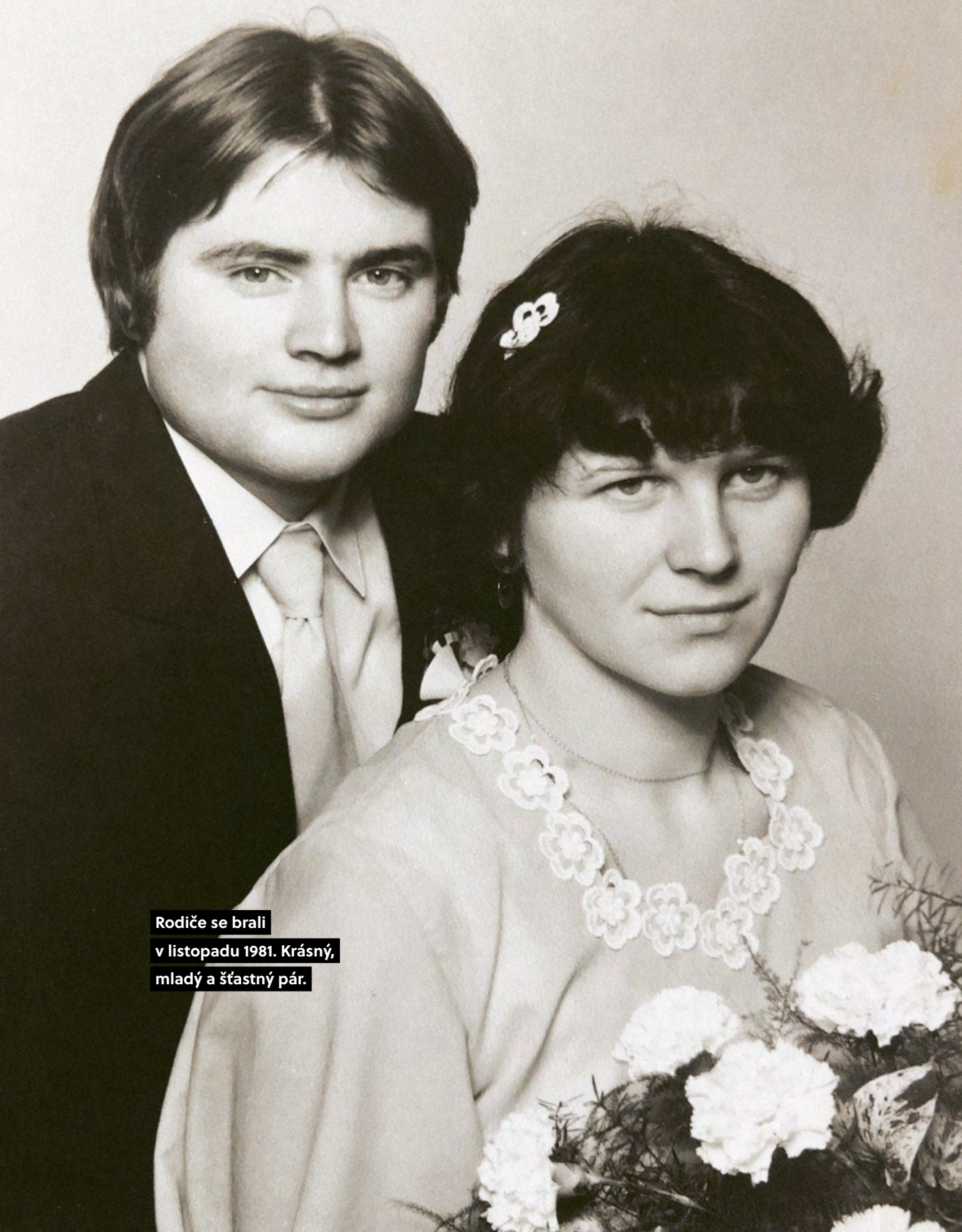
Rodiče se brali v listopadu 1981. Krásný, mladý a šťastný pár.