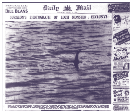
fotografie lochnessky v dobovém tisku