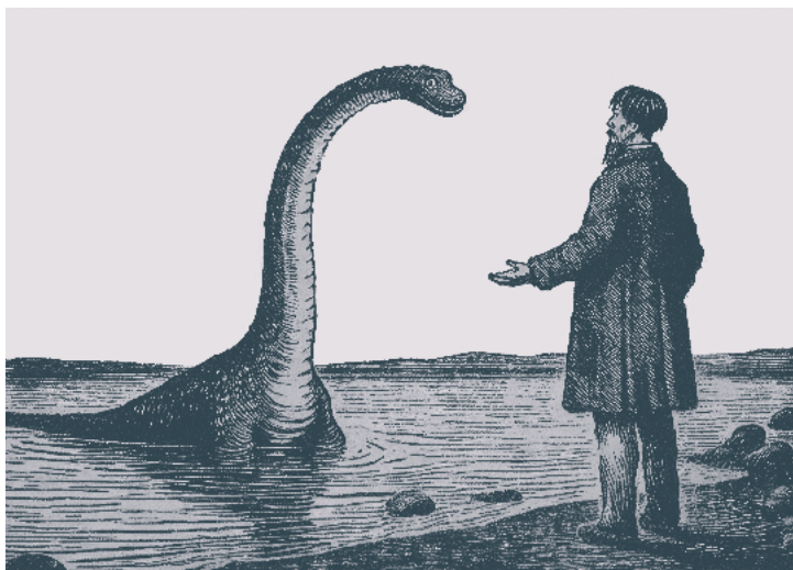
setkání s lochnesskov

Legenda o lochnesce sahá hluboko do minulosti. První písemná zmínka pochází už ze 6. století. Jde o legendu Vita Columbae , která zachycuje život mnicha svatého Kolumby. Ten šířil křesťanství mezi piktskými kmeny a během jedné ze svých misionářských cest zavítal právě i k jezeru Loch Ness. Tu se na něj „s velkým řevem a otevřenými ústy vrhlo strašlivé monstrum“, které nakonec za pomoci znamení kříže Kolumba zahnal zpět do hlubin. Tam si pokojně žila několik dalších staletí.