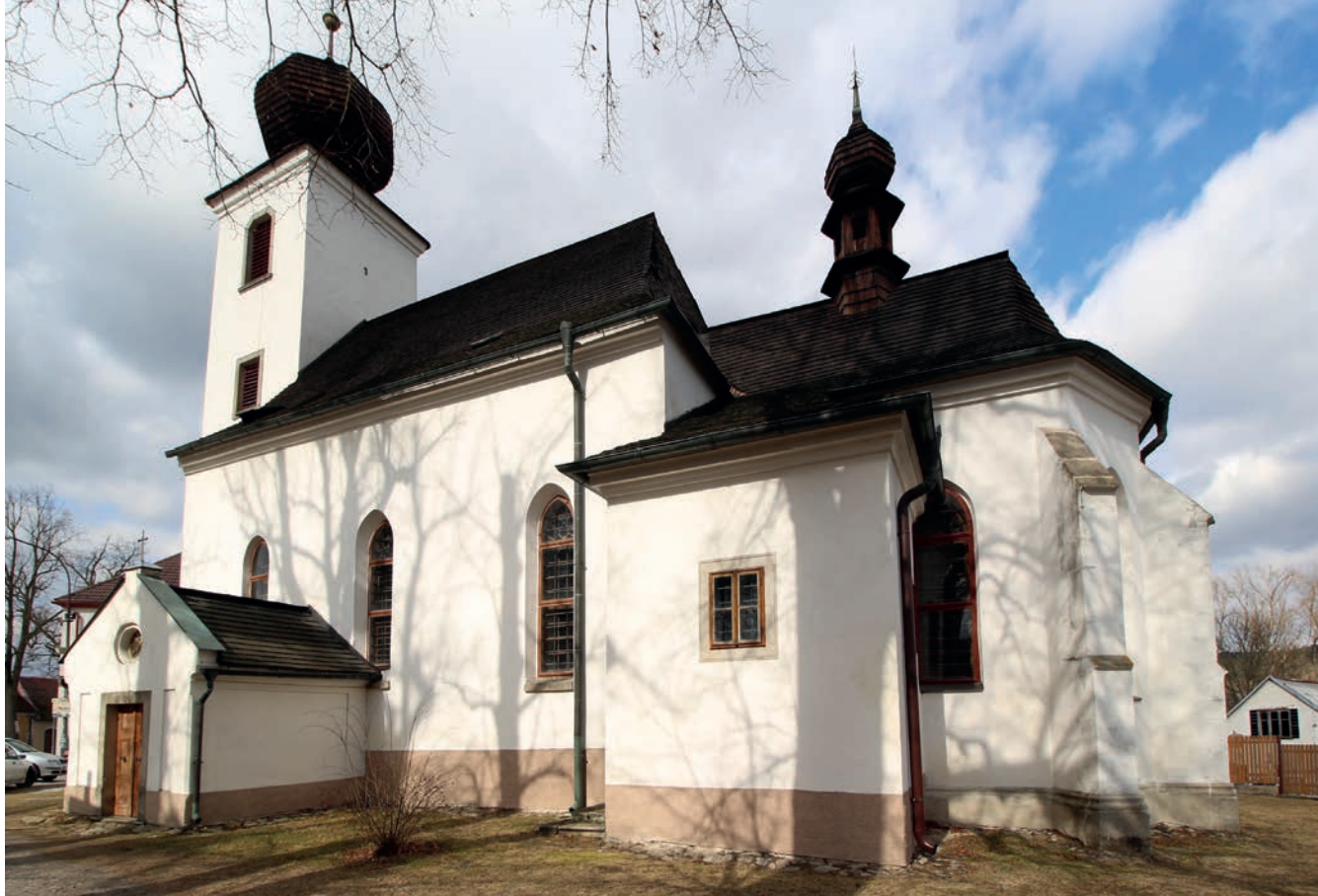
1.1 Český Rudolec, kostel Narození sv. Jana Křtitele, celkový pohled od jihovýchodu

Cizkrajově a Slavonicích jako pokračování tradice českých dvoulodí a zároveň jako ohlas výstavby dvoulodního kostela sv. Jakuba Většího v Telči. 161 Další uměnovědné texty a syntézy vycházely většinou z výše uvedených vlastivědných prací, aniž by nějak zásadně posunuly poznání jak rudolecké, tak ostatních souvisejících dvoulodních staveb. 171 Obvyklou praxi nekritického přejímání poznatků ze starších prací pak dokládají opakované omyly, jako např. zmiňování (dnes) neexistujícího sanktuáře, nebo situování empory na severní stranu lodi místo na západní. 181