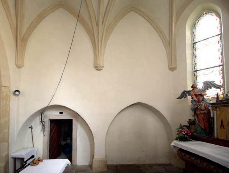
1.5 Český Rudolec, kostel Narození sv. Jana Křtitele, celkový pohled na severní stěnu kněžiště s arkádovými oblouky při starší stěně kaple/sakristie (foto: Roman Lavička, 2021)