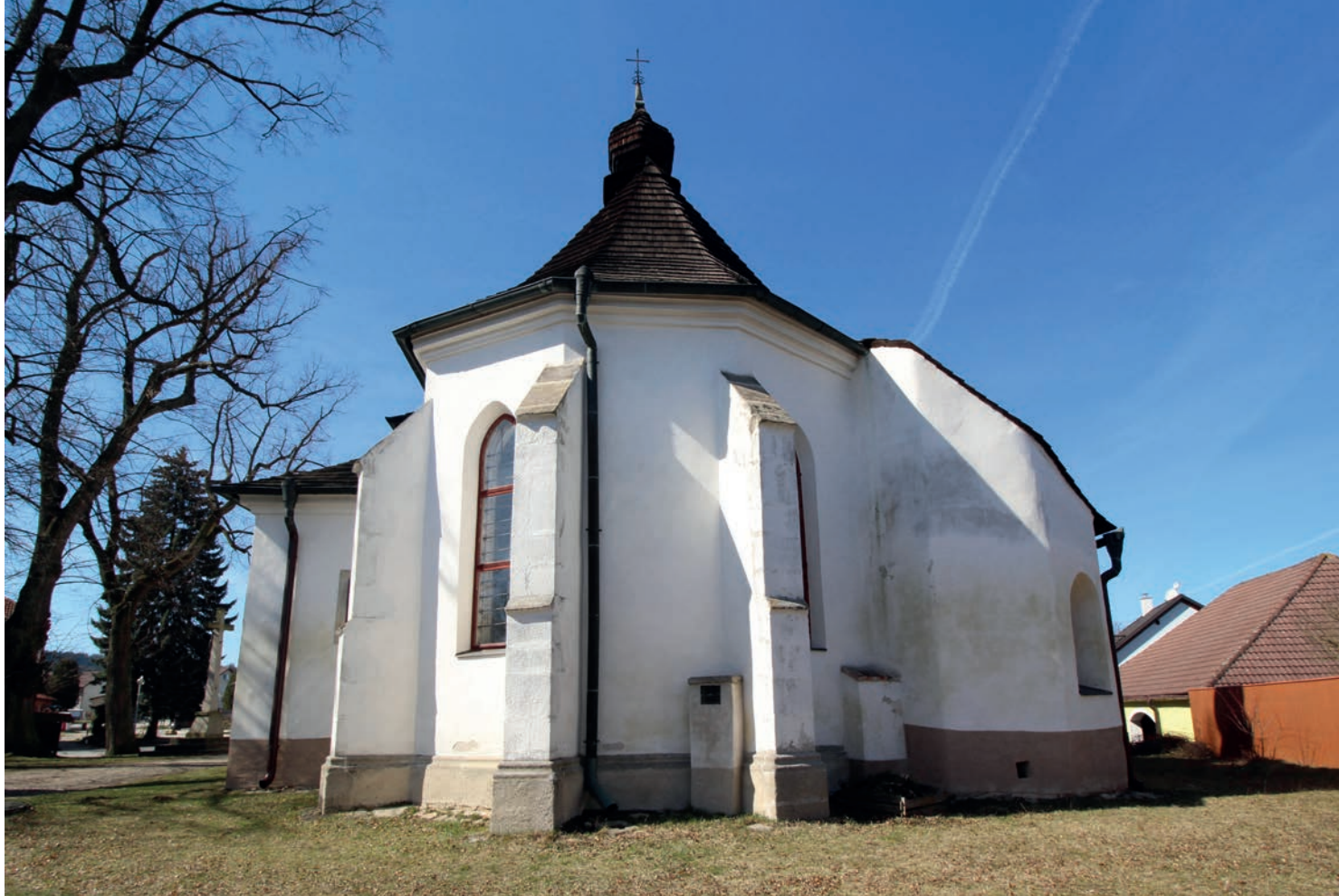
1.4 Český Rudolec, kostel Narození sv. Jana Křtitele, celkový pohled od východu, v koutu mezi kněžištěm a kaplí/sakristií patrný blok staršího zdiva

zejména při jeho klenutí, a proto vyrostla podél staré severní zdi rozšiřující se přízdívka, která upravila půdorys do pravidelného tvaru a podchytila tlak nové klenby. 126 Ve spodní části přiložené zdi se otevírá dvoudílná slepá arkáda sahající do výše asi 2–2,5 metru, aby nejen ušetřila hmotu zdiva, ale i umožnila bez zásadních změn nadále používat stávající vstup do kaple. V koutu při styku