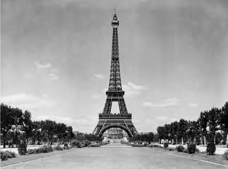
Eiffelova věž v době pařížské výstavy, jež se konala od 15. dubna do 12. listopadu 1900 a která se zhruba 50 miliony návštěvníky dodnes patří mezi nejúspěšnější světové výstavy

vliv mezinárodní právo a lidská práva. Nejen to, rýsuje se nové chápání světa. Vnitrostátní řešení problémů fungují stále méně, nové konflikty se už netočí výlučně kolem států a vnitřní správy nebo rozdělování zdrojů. Jinými slovy, tyto nové konflikty nezapadají do klasického politického schématu levice kontra pravice, do ostrého protikladu pokroku a tradice.