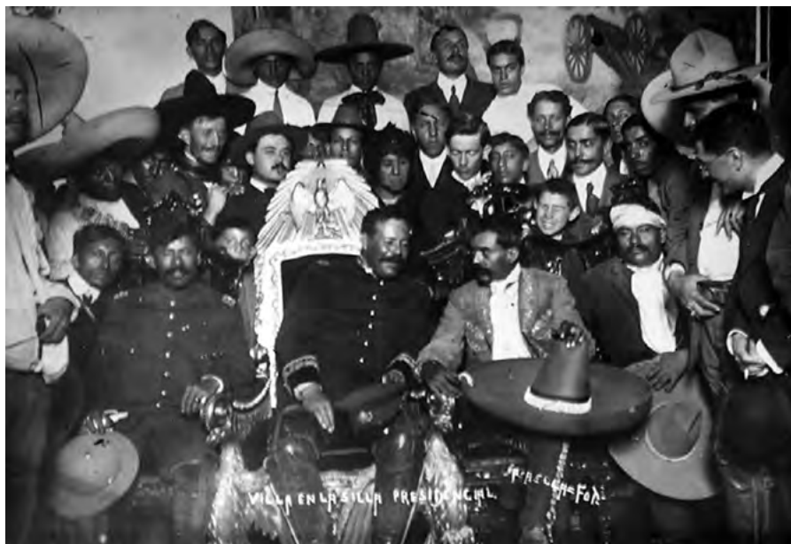
Vůdce mexické revoluce Emiliano Zapata a jeho spojenec Pancho Villa v prezidentském sídle (prosinec 1914)

statných, ale nedokonalých reforem, politických kompromisů spojených s korupcí, nátlakem i nacionalistickou propagandou. Tento obojetnický režim, jenž nepředstavoval ani rozvinutou demokracii, ani neskrývanou diktaturu, se udržel po desetiletí a ochránil Mexiko před krvavými extrémními diktaturami, které se v meziválečném období ustavily v jiných zemích. Byla to fáze zotavení po desetiletí občanské války, inflace, hladu a nedostatku.