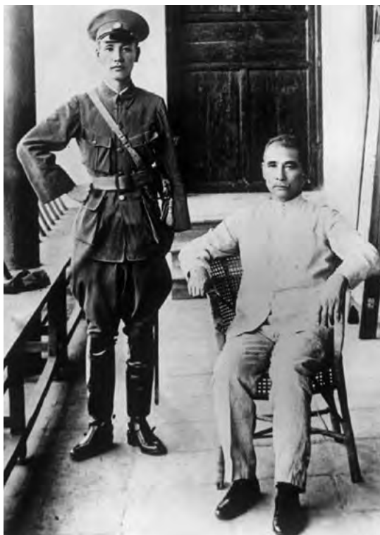
Čínský generál a vojenský diktátor Čankajšek (vlevo) se zakladatelem Kuomintangu Sunjatsenem (1923)

Kuomintangem, stranou významného reformátora Sunjatsena. Za občanské války se brzy dostal do vedoucího postavení jeden z jeho následovníků, pozdější generál Čankajšek, a získával stále větší moc především na jihu země. Na přelomu 20. a 30. let se mu konečně podařilo ovládnout celou Čínu a zároveň musel od té doby nepřetržitě čelit japonské agresi.