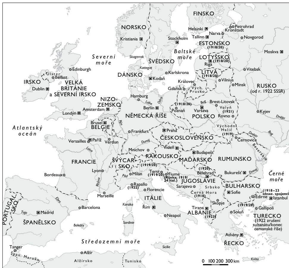
Evropa po první světové válce (1919)

vyřešit. Zhroutil starých velkých říší znamenalo konec nadnárodních spojeních a vedlo ke striktní izolaci, navíc fakticky neřešitelné otázky menšin při vytýčování nových hranic v sobě skrývaly časovanou politickou nálož. Etnické rozpory se rychle spájely s jinými vnitropolitickými ohnisky krizí nových států, které si nedokázaly rozvinout stabilní demokratický systém, a navíc se brzy dostaly do sevření hrozby komunistické revoluce a vojenské diktatury.