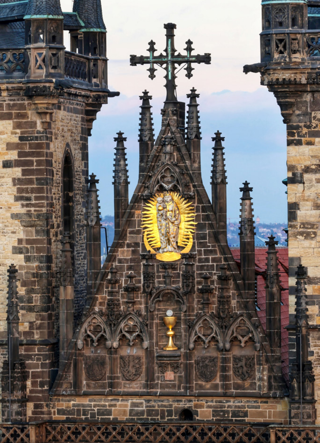
Pod obraz Panny Marie se na průčelí Týnského chrámu vrátil v roce 2018 kalich s hostií jako symbol smíření hašteřivých církví