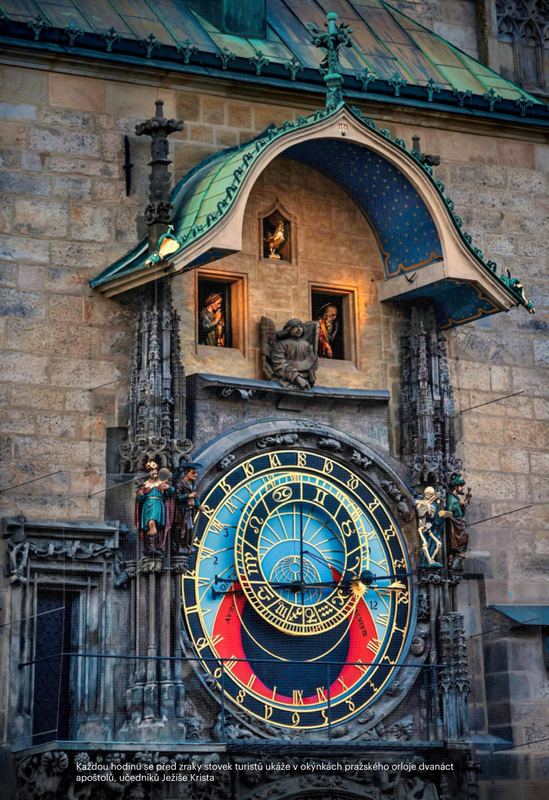
Každou hodinu se před zraky stovek turistů ukáže v okýnkách pražského orloje dvanáct apoštolů, učedníků Ježíše Krista