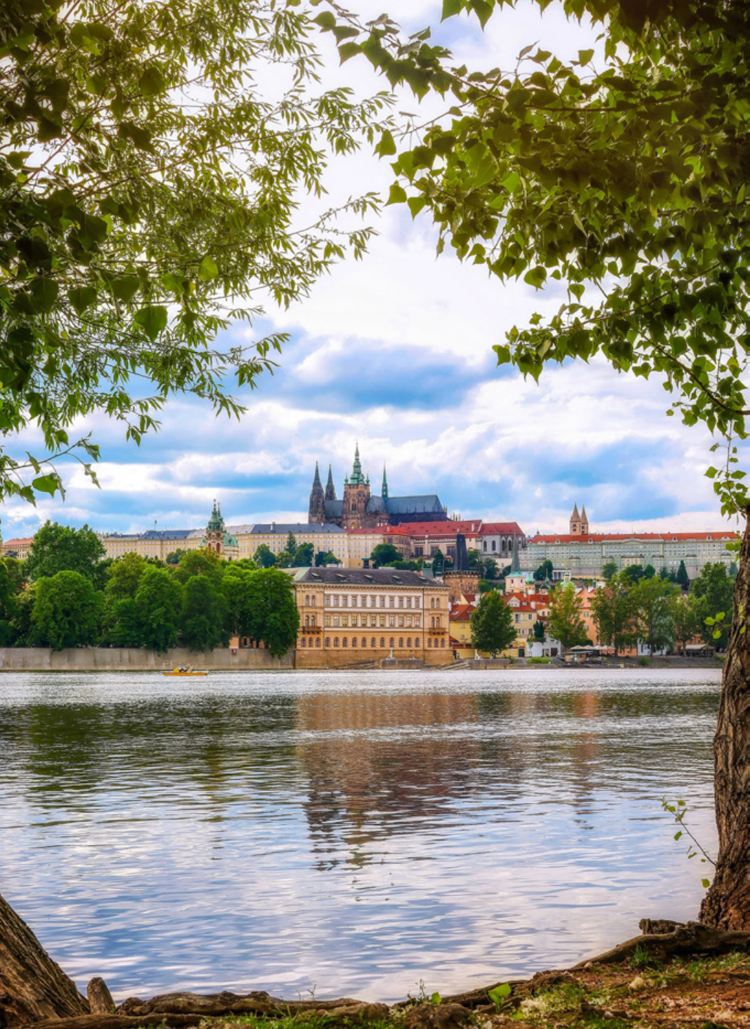
Jiří z Poděbrad byl jediným českým králem, který nepocházel z panovnického rodu, ale z panského stavu domácí šlechty