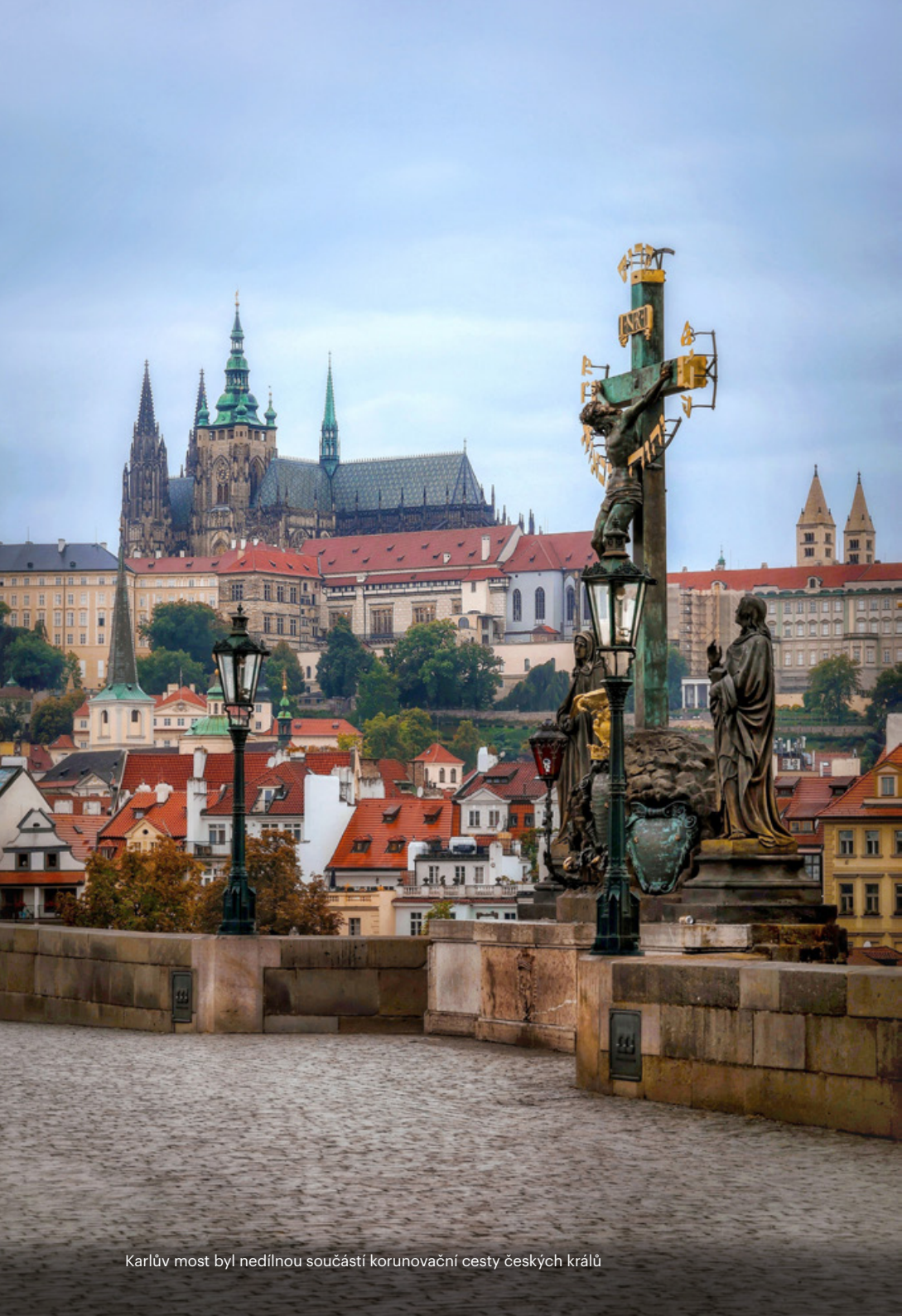
Karlův most byl nedílnou součástí korunovační cesty českých králů