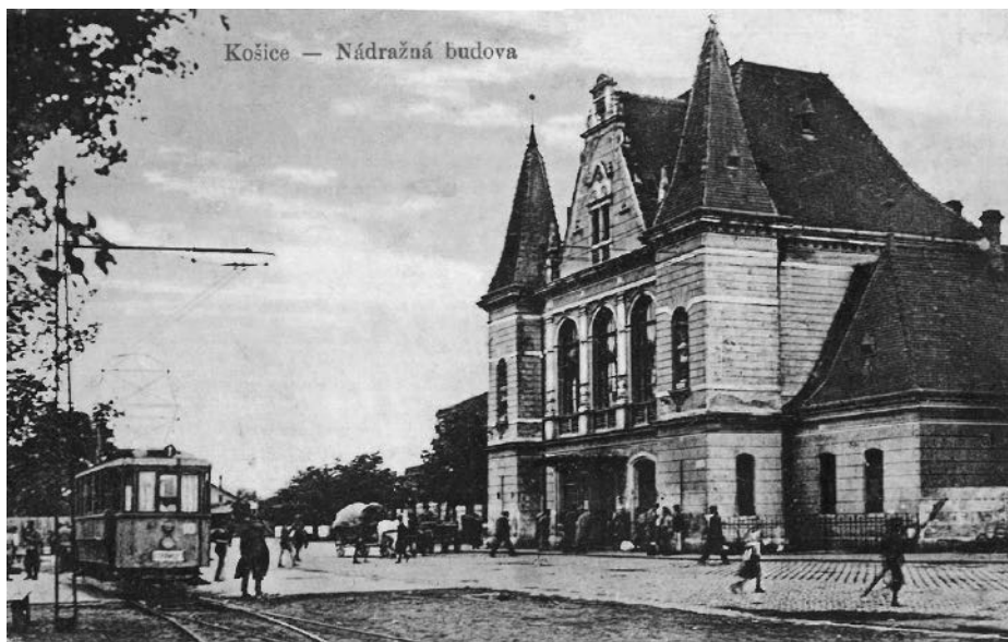
Nádražní budova v Košicích na dobové pohlednici.

pod vlivem nádraží v bavorském Mnichově. 73 Po romantismu a novogotice nastoupila novorenesance. Uvedme alespoň architekta Carla Schlimpa a v roce 1885 bohužel zbytečně zbouranou památkově chráněnou budovu koncového nádraží Rakouské severozápadní dráhy Praha-Těšnov z roku 1872.