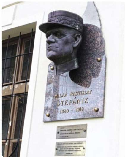
Košariská – busta na rodném domě M. R. Štefánika

Milan Rastislav Štefánik (1880–1919) byl synem evangelického faráře z hornaté oblasti mezi Piešťany a Senicou na severozápadním Slovensku. Fara ve vsi Košariská,