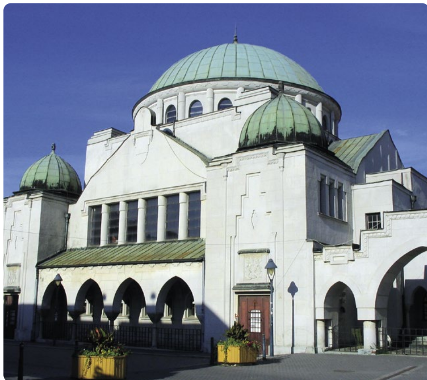
Trenčín – synagoga

Trenčínská univerzita nese jméno politika a symbolu reformy z roku 1968 Alexandra Dubčeka. Ten přišel na svět v asi 20 km vzdáleném Uhrovci: v tomtéž domě, kde se narodil i tvůrce moderní spisovné slovenštiny, Ľudovít Štúr.