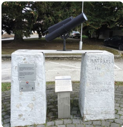
Košariská – Štefánikův pomník

kde se narodil, je dnes nejen opatřena pamětní deskou, ale také přístupná jako expozice.