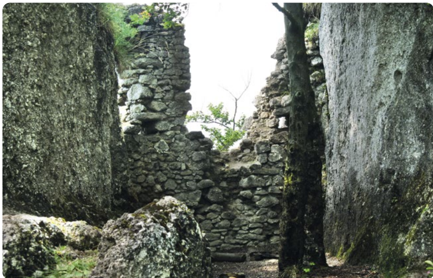
Súľovské skály – zbytky hradu

Středověký hrad vznikl jako hrad královský již ve 13. století. Brzy ale přešel do rukou šlechtického rodu Súľovských a těm patřil přes tři století, přestože ho roku 1440 dobyli stoupcenci adepta uherského trůnu Vladislava Jagellonského a v polovině 16. století se tu načas usadili loupeživí rytíři. Tehdy se hrad pravděpodobně jmenoval Roháč. Ještě na konci 17. století byl přestavěn, ale při ze-