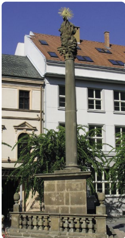
Trenčín – kašna na náměstí

známý pod jménem Tatra. Stačí projít přes recepci na vyhlídkovou terasu.