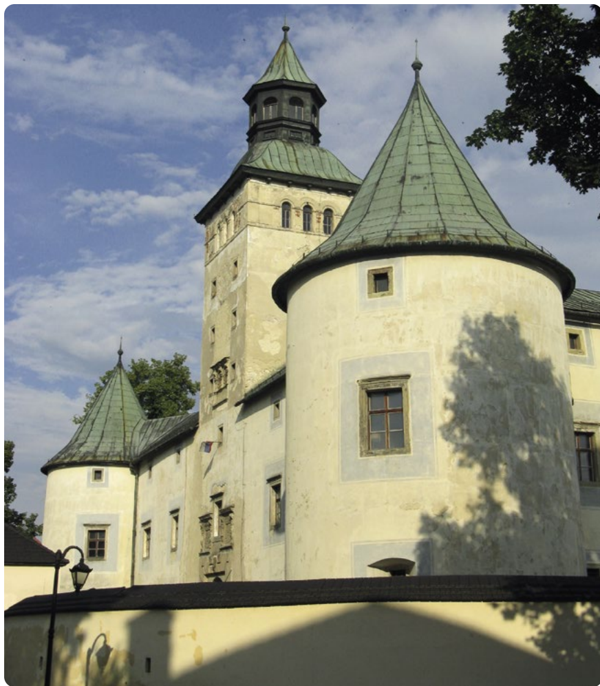
Bytča – zámek

mětřesení v roce 1763, které jinak škodilo spíše na jižním Slovensku, se část skal sesunula a objekt se stal neobyvatelným. Poměrně rychle pak zmizely i jeho ruiny. Dnes ho dokáží správně lokalizovat jen archeologové, většinou na základě nejrůznějších drážek ve skále apod. Je velmi nesnadné odlišit, co je zeď a co jen otesaná skála.