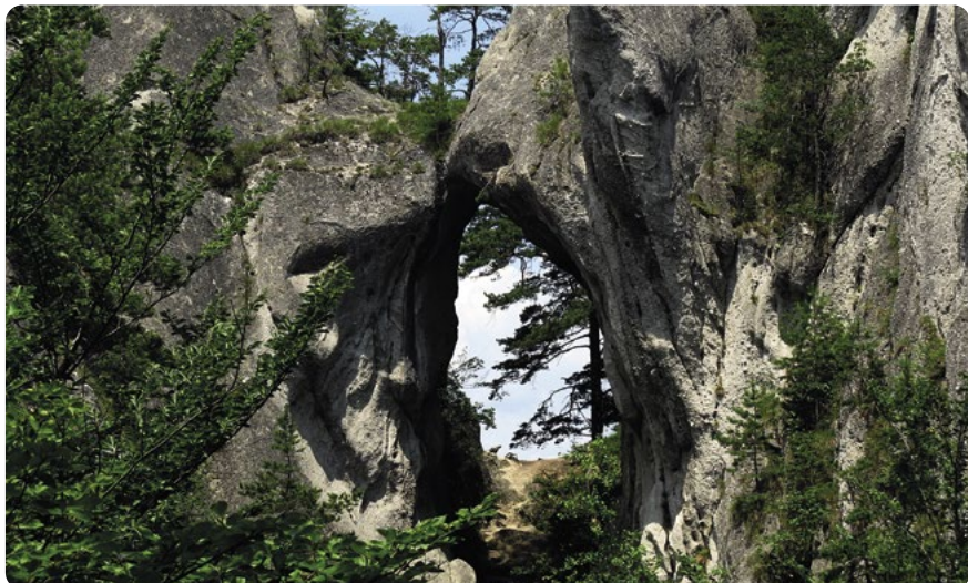
Súľovské skály – Gotická brána

asi stačí označení skalní město . Soubor jedinečně tvarovaných skal až bizarních tvarů vznikl během statisíců let, kdy původní až 1 000 metrů mocnou vrstvu usazených hornin, hlavně starotřetihorních pískovců a slepenců, narušily voda, mráz i vítr. Původně skály vznikaly na mořském dně, takže při postupném vynořování zasáhl do formování krajiny dokonce i mořský příboj. Najdete tu jehly, skalní věže, okna, až tři metry vysoké skalní hříby i jiné unikáty. Samozřejmě že mají svá jména: setkat se tu můžete třeba se 13 metrů vysokým skalním oknem přezdívaným Gotická brána, jinde je Soví hlava; a jiná skála je tak majestátní, že dostala jméno (poněkud neuctivě) podle mocné císařovny: Mária Terézia.