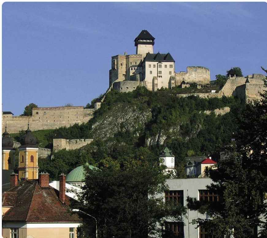
Trenčín s hradem v pozadí