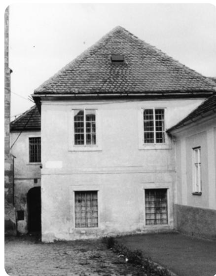
Budova staré triviální školy, v jejímž prvním patře byla takzvaná hudební síň. Mezi budovou a kostelem je průchod a schody pod městské hradby.