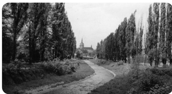
Úsek Padráského potoka od železničního viaduktu po hlavní silniční most. Místo našich plaveb a vodních staveb. Po stranách topolových stromořadí vpravo Horáková a vlevo Čapková ulice. (Ze sbírek Muzea Dr. Bohuslava Horáka v Rokycanech)