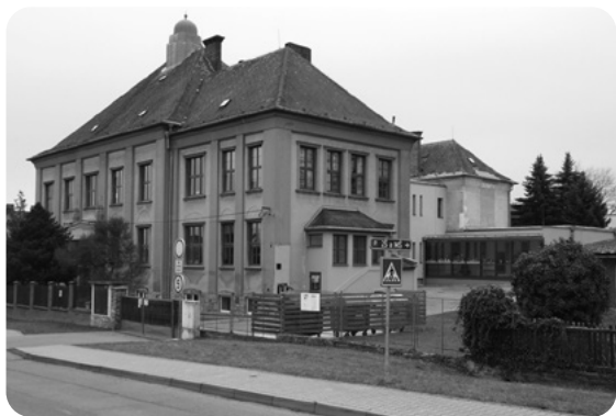
Nová chotikovská škola, otevřená roku 1924.

Dnešní stav po 100 letech při pohledu od silnice ze severu. Verandou, původně dřevěnou a kdysi zelené barvy, se vstupovalo do bytu ředitele školy, místa autorova setkání s Janem Drdou.