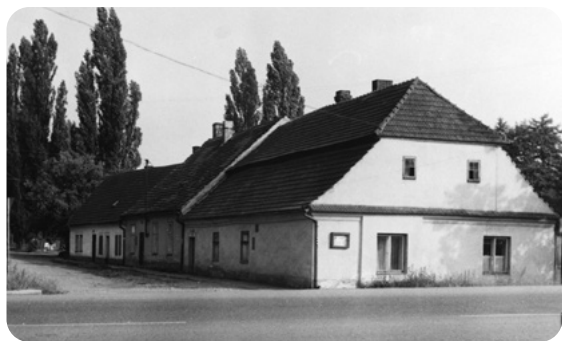
Tři domky na začátku Horákovy ulice, nejvíce obhrožované rozvodněným Padrťským potokem. Později oprávněně z bezpečnostních důvodů demolované.

mek těsně u řeky patřil rodině Kynclově a třetí byl bývalým pekařstvím pana Macúcha. Členům uličního výboru KSČ se potichu přezdívalo uličníci.