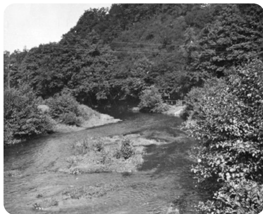
Soutok Padrského a Boreckého potoka a řeka Klabavka o něco níže pod Strání. Přes Borecký potok vedl můstek na takzvaný ostrůvek. – Řeka Klabavka pod Strání.

u hostince Na Železné. 34 Pamatuji se, jak jsme se jako kluci na rohu této křižovatky u provozovny holičství a kadeřnictví posmívali kolonám zklamaných nizozemských fanoušků, kteří projížděli kolem po porážce Ajaxu Amsterdam od tehdy silné a slavné Dukly Praha. Jejich vozy a autobusy musely na rohu zpomalit a ostře odbočovat vpravo, kudy vedla tehdy jednosměrná ulice směrem na Plzeň, a to byla chvilka, kdy jsme si je jako mladí fanoušci vychutnávali. Fandil jsem od konce padesátých let Spartaku ZVIL Plzeň, jak se tehdy jmenovala dřívější i dnešní Viktorie Plzeň, přechodně též Škoda Plzeň. Klub během desítek let nejednou sestoupil do druhé ligy a jeho největších úspěchů jsem se ke své velké radosti dočkal až v současnosti, po mnoha desítkách let. Přesto z klubu vzešlo několik skvělých nezapomenutelných hráčů, na které tu a tam s kamarády vzpomeneme. Plzeňský stadion měl již tehdy moderní dvoupatrovou tribunu, která je jeho součástí dodnes. Byl obehnan atletickou dráhou. Pamatuji, jak na ní před jedním z důležitých utkání závodil olympijský vítěz v překážkovém běhu na tři kilometry, belgický policista