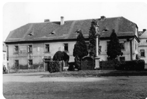
Hotel Bílý lev. Vpravo prostory a dům, kde trávili zimní období „světští“.