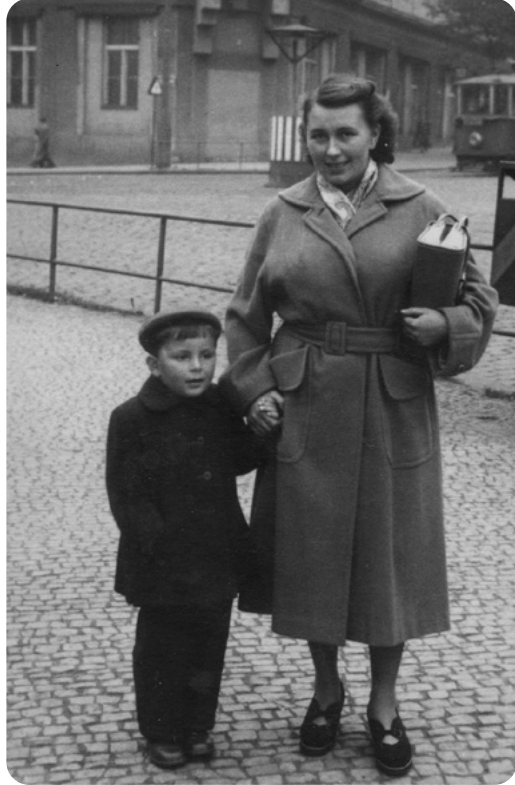
V předškolním věku s maminkou v Plzni.

jezdíval domů do Příšova kolem, prý se dle tvrzení pamětníků snažil na mne podívat z okna autobusu.