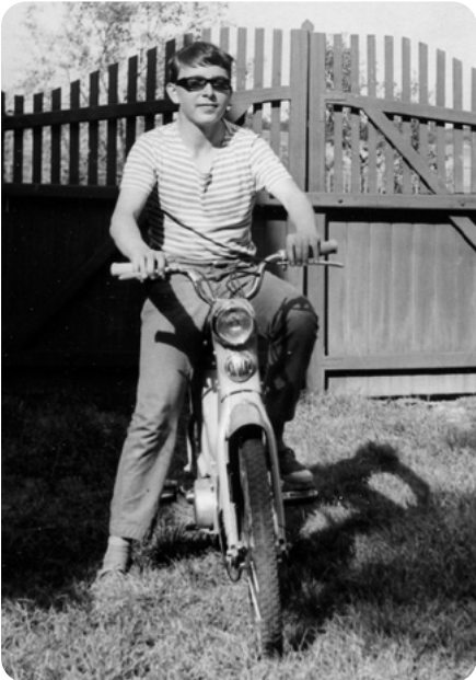
Poslední prázdniny v Chotíkově u babičky po skončení ZDŠ v roce 1966. Již na mopedu.

začal dojíždět autobus od jihu. To však bylo již v době, kdy mé dětství skončilo.