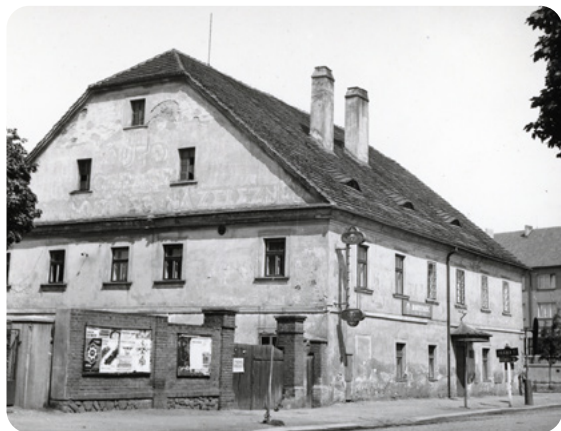
Hostinec Na Železně. Stav na počátku šedesátých let 20. století i s možným přístupem do výčepu přes dvůr.