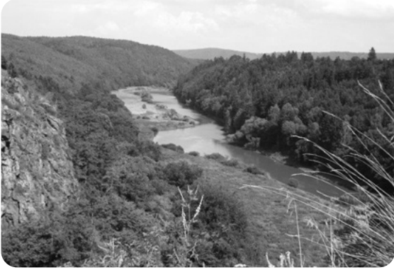
Pohled na obě laguny řeky, kdysi přístaviště vorů z hradu Krašov.

se pokusil pomáhat Spolku pro záchranu hradu Krašova. Ještě se o tom zmíním v závěrečném dílu knihy.