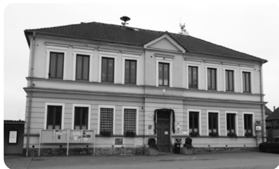
Bývalá stará chotkovská škola, dnes obecní úřad, pošta a knihovna.

nici zbyly, popichovaly pokřikováním: „Češi mají bleši!“ Ale Češky se nedaly a odpovídaly: „Ale Němky vši a štěnice!“ I přes toto špičkování prý byly vztahy mezi dětmi obou národností dobré a kamarádké. Když po válce německé rodiny opouštěly s 50 kilogramy na zádech pěšky po silnici kolem dědečkova domu vesnici, prý se dospívající děti loučily s pláčem. Dospělí dle vyprávění maminky a dědečka prosili: „Nechte nás tady, všechny škody odpracujeme a napravíme, jen nás nevyhánějte.“ Ještě nějaký čas podle matky psala bývalá maminkina kamarádka odněkud z Porýní, snad prý z Gastropraxelu, aby jí „Jarmila poslala recept na ty dobré české švestkové knedlíky“. Pak však dopisy ustaly. Zda nebyly vůbec napsány, anebo je náš poválečný režim zadržoval, se již nedozvíme. Otázka poválečného odsunu Němců je komplikovanou a bolestnou kapitolou naší historie a do mých pamětí vlastně