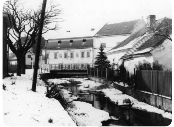
Poslední a největší mlýn na strouze, později STS.