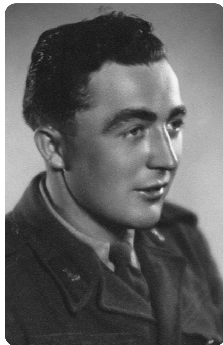
Otec jako voják.

Od pohledu jsem otcova syna, s nímž jsem samozřejmě nebyl pokrevně příbuzný a který se svojí matkou bydlel ve Volduchách, znal, ale posléze mi zmizel z očí. Byl o dva roky starší než já. Zlá vzpomínka na nevážené a nezdařené manželství pronásledovala otce celý život a chtěl mne od něj za každou cenu uchránit. Bude o tom ještě nejedna zmínka, zejména v kapitole o nezapomenutelné Lence, mé veliké lásce. O svém synovi se otec domníval, že nemusí být jeho otcem, ale formálně a úředně tuto citlivou záležitost nikdy nezpochybnil. Já jsem mezi nimi však jistou podobu viděl. Byl jsem tedy ze strany obou rodičů jakýmsi nepravým jedináčkem. Oba rodiče se snažili mít dalšího potomka, ale nezdařilo se jim to. Otec prý v dospělosti na vojně prodělal příušnice a doprovodný komplikující zánět varlat jej učinil neplodným. Vojnu absolvoval otec jako řidič v Pošumaví. Zařazení do PTP jako syn „kulaka“ unikl vzhledem k tomu, že se jeho starší bratr po návratu z totálního nasazení stal členem KSČ a za bratra se přimluvil. Pro službu u pohraniční stráže však byl i tak nespolehlivý, a tak jen vozil proviant a prádlo.