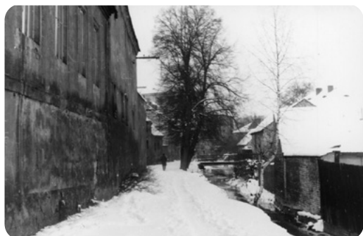
Část Mlýnské strouhy pod městskými hradbami.