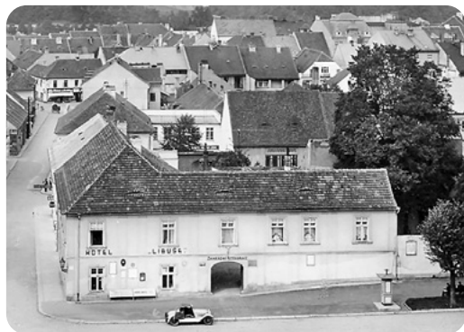
Hotel Český dvůr, hotel Morava, Černý kůň a již tehdy uzavřený hotel U Libuše. (Ze sbírek Muzea Dr. Bohuslava Horáka v Rokycanech)

Vedle nového domu později otec vystavěl garáž, malý mělký bazén a terasu, pod níž byl sklípek na ovoce propojený s hlavními sklepy; uvnitř domu se modernizovala koupelna, oddělilo se jako samostatná místnost WC a také vznikla podle přání maminky dosti prostorná spíž. Na zahradě otec pořídil matce skleník, postavil kolnu pro králíky a náradí, kde později stál i můj malý motocykl, a ohradil zeleninové záhony hezkou zdobnou zídou, na které bylo možné pohodlně sedět. V blízkosti dokonce vystavěl ozdobnou psí boudu. Vše později přišlo nazmar. Na zahradě byla velmi úrodná půda a dobře se tam