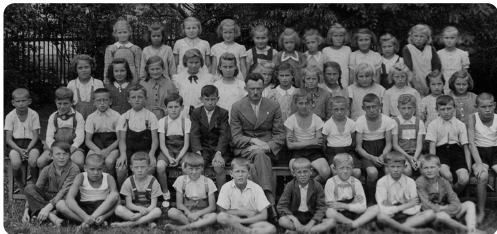
Žáci německé školy v roce 1941. Maminka v zadní řadě čtvrtá zprava.