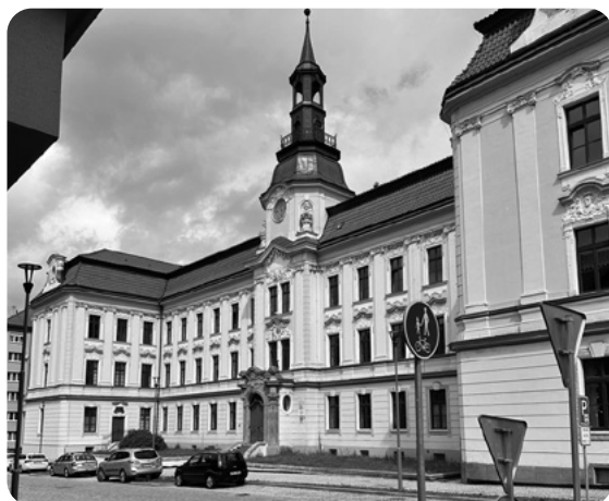
Její dnešní vzhled, kdy je střední odbornou školou.