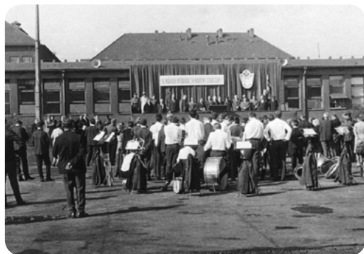
Při otevření továrny vyhrávala před- chůdkyně rokycanské Hudby mladých, zřízená v Djšíně.