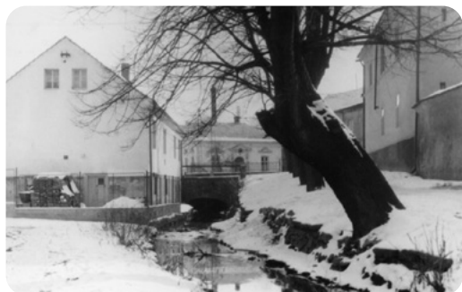
Takzvané Dolní příkopy, v pozadí Městské lázně.

O něco později ustoupila výstavbě panelových domů také lokalita v místě a okolí Děkanského rybníčku, kam jsme ještě chodili bruslit a zejména okolí Mlýnské strouhy. Ta byla až na svoji počáteční část v Alejích později zlikvidována. Mlýnská strouha umožňovala po staletí provoz řady mlýnů i dalších podniků (např. jircháren). Její nábreží a okolí byla značně romantická a malebná, avšak v době socialistického nepořádného hospodaření a neúcty k pa-