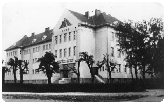
Zbývající dvě rokycanské základní školy: V ulici Míru bývalá měšťanka z 19. století a v Parku pionýrů bývalá Masarykova dívčí škola.

zeměpisného atlasu to pro mne byla hračka, jen zalesněný hřeben Plecháč jsem nadneseně označil jako pohoří, což učitel s úsměvem opravil.