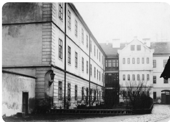
Základní škola v Rokycanech Za Radnicí.