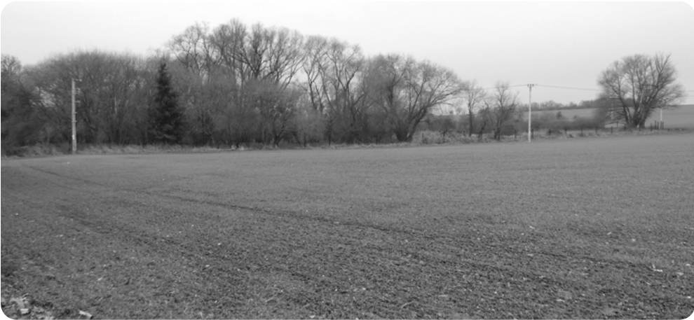
Zcelený a meliorizační odvodněný lán mezi chotíkovskou školou a Freiteichem, do konce padesátých let bohatě osídlený mokřad. Niže nově dorostlé stromy obnoveného prameniště potůčku napájejícího Freiteich.

Hluboká a necitlivá orba zničila i několik mokřadů v okolí vesnice, zmizely postupně studánky a stružky, které byly sice nenápadné, ale napájely malé rybníčky v různých místech vesnice a v jejím okolí. Zmizela má oblíbená studánka v „bažině“ na mírném svahu, sklánějícím se od západního rohu školní zahrady až k požární nádrži na Freiteichu, v jejíž blízkosti bývalo na louce tohoto mírného svahu, kosené po staletí jen kosami sedláků, množství různých motýlů, brouků i ptáčků a kde jsem mohl pozorovat několik různých druhů žab, ještěrky, vodní vážky, šídla i vodoměrky. 22 Mohl bych dále vyprávět, kolik podobných romantických a ekologicky cenných biotopů zmizelo, ale jen bych tím jítřil vzpomínky generací, které toto „rozorávání mezí“ zažily. Později zmizel i úvoz, který za zadní částí školního pozemku mířil mezi dvěma řadami trní ke křížku a dále k vlkššskému lesu. Tento úvoz byl z obou stran ohraničen trnitými větrolamy, kde se skrývali zajíci a různé polní ptactvo. Tam, kde byla stěna mělkého úvozu volná, rostl na travnatém svahu zvláštní druh divokých jahod, kterým babička i maminka říkaly „strunkáče“. Měly hořkosladkou chuť a mně velmi chutnaly. Dozrávaly později než běžné lesní jahody a v létě zaháněly žízeň.