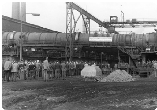
Slavnostní zahájení výroby u rotační pece.