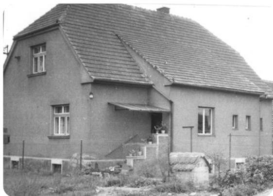
Dům v Horákově ulici č. p. 81/III. Pohled zezadu v šedesátých letech. Vlevo v přízemí okno mého studentského pokoje. Pozemek je oddělen plotem od pozemku bývalého Novákových hospodářství.