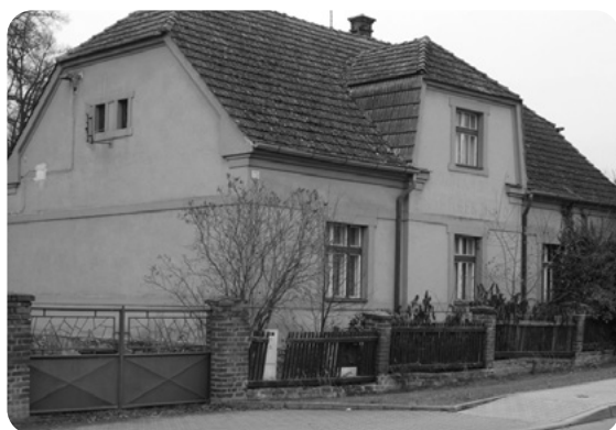
Autorův rodný dům. Vlevo v přízemí okno rodného pokoje.