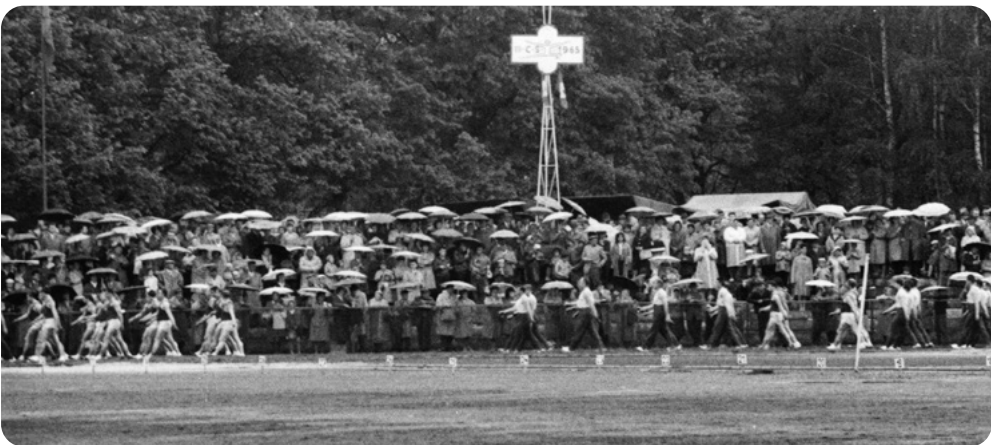
I při nepříznivém počasí přilákala spartakiáda mnoho diváků.

Naše cvičení proběhlo za hustého deště a na škvárovém hřišti se tvořily louže. Spartakiádní úbory starších žáků, červené trenýrky a bílá trička, zcela ztratily své barvy. Ihned po cvičení jsme se umyli ve vedlejším koupališti, já jsem se rychle převlékl do muzikantské uniformy a s Hudbou mladých hrál pochodové nástupy dalších kategorií cvičenců.