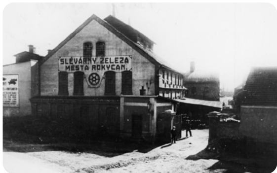
Žampírky před znárodněním. (Ze sbírek Muzea Dr. Bohuslava Horáka v Rokycanech)

kycan. On cestou na Kyšickém vršku únavou usnul, a když koně, větrící již na kilometry daleko svoji stáj, přijeli bez kočího domů, maminka se obávala nejhoršího. Rozespalý Slávek ji však uklidnil a rozjařený bezstarostný manžel dorazil domů posledním večerním vlakem, o nějakou část výdělku však lehčí. To již byli koně v domovské maštali, ošetření a Slávou napojení i nakrmení.