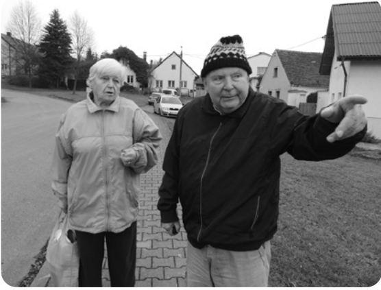
Setkání s nevřeňskou pamětnicí konce čtyřicátých let v prosinci 2024.