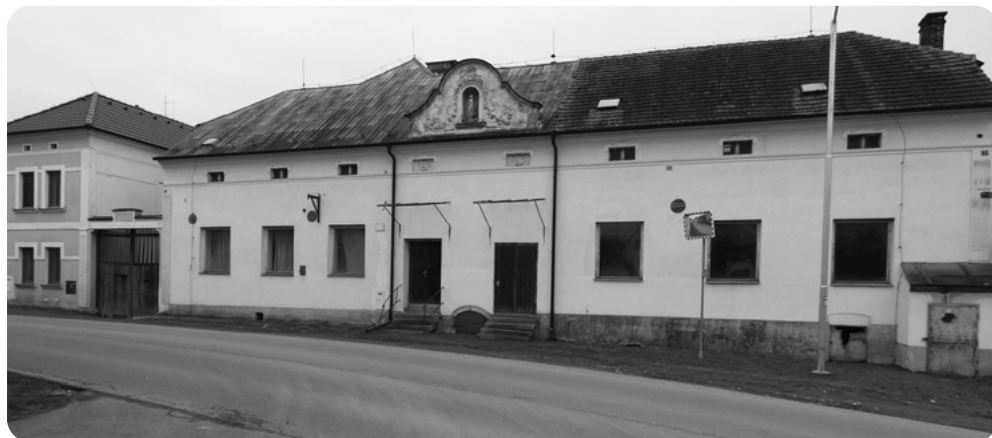
Hostinec U Tajšlů, dnešní stav. V levé části býval hostinec, v pravé kinosál.

Ve vesnici, v níž ač leží pouhých osm silničních kilometrů od středu Plzně, žilo tehdy o něco málo více Němců než Čechů, se dědečkovi za první Československé republiky dařilo dobře. Ovládal několik řemesel a lidé, včetně bohatých německých sedláků, si jej jako pracovitého zručného univerzálního řemeslníka vážili bez ohledu na národnost. Ač byl ještě mladý, z Velké války si přinesl mnoho zkušeností. 11 Právě tato mladá, silná a vlastenecky nadšená generace byla ve dvacátých letech