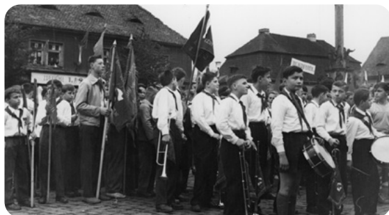
Pionýrstí trubači z jiné školy.