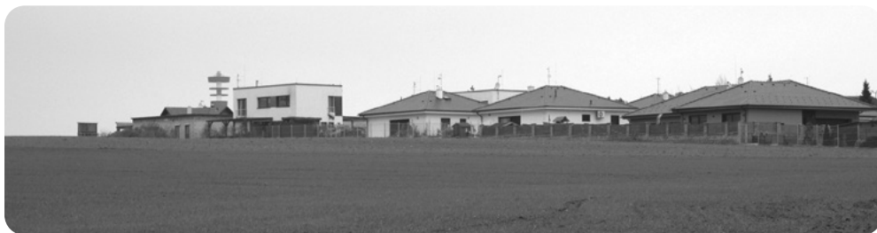
Chotíkov, rok 2024. V místě okraje moderní čtvrti vesnice vedl úvoz ke křížku a dále ke Kůští. V dáli v pozadí komín chotíkovské spalovny.