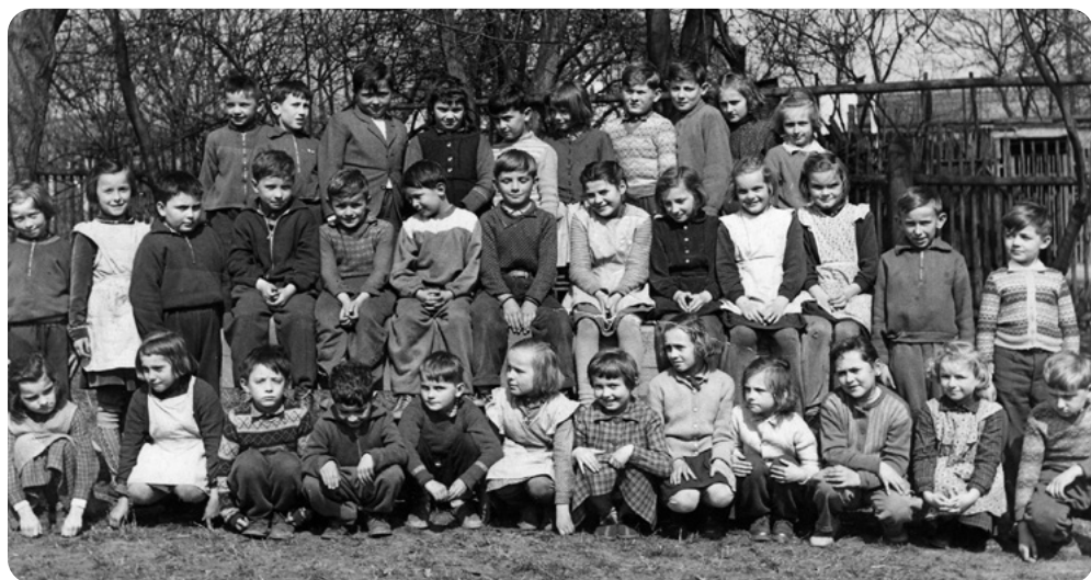
Fota z první a spojené druhé a třetí třídy. Květen 1958 a červen 1960.