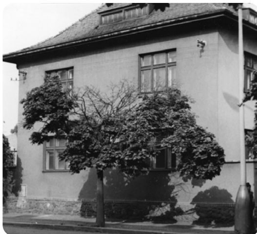
Foltův dům v Pražské ulici, za kterým se rozprostírala veliká zahrada.