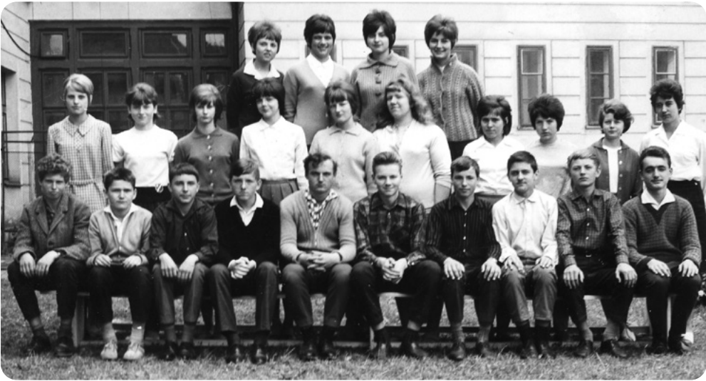
Devátá třída, červen 1966. Autor sedící třetí zleva.

eroticky laděné. Já jsem byl v tomto směru dost stydlivý a nesmělý, doslova zaostalý a jakýkoli projev zájmu o některou ze spolužaček nebo dívek z nižší třídy jsem se styděl projevit z obavy z posměchu spolužáků. V tomto věku děvčata přirozeně vyspívala rychleji než stejně staří hoši. Snažil jsem se alespoň pracovat na tom, abych za ostatními nezaostával v tělocviku a nevyhýbal jsem se různým chlapeckým akcím, které, jak se pubertální hoši domnívají, by mohly děvčatům imponovat. Ono