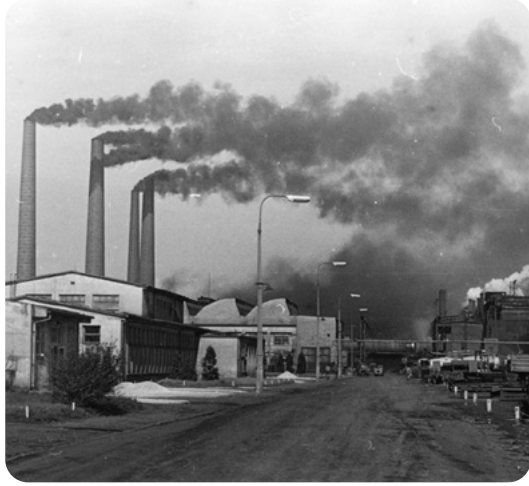
Bezohledné znečišťování širokého okolí dýmem z továrny.