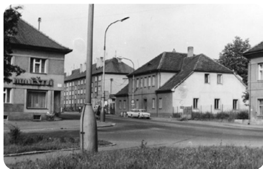
Křižovatka u Železné.