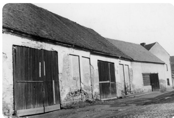
Stodoly v ulici Josefa Knihy proti 11leté střední škole