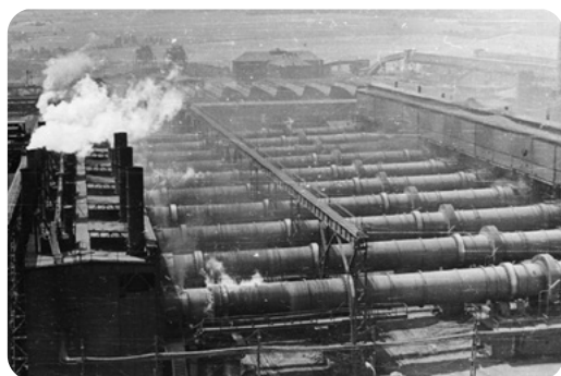
Série rotačních hrudkovacích pecí.