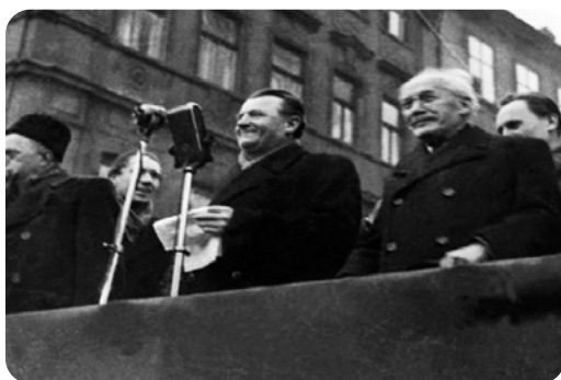
Gottwald a Nejedlý při komunistickém puči 25. února 1948.

Přál bych si, aby v duchu nápísu hodnotícího osobnost Zdeňka Nejedlého, jehož rané historické práce jsou cenné, ale jeho pozdější působení bylo škodlivé, byly i v této knize posuzovány všechny osoby, o nichž si dovoluím vyjádřit se záporně nebo nejednoznačně.