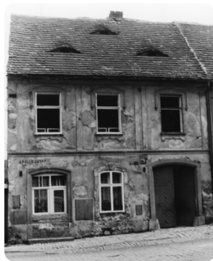
Dům na počátku Pražské ulice nad budovou bývalých lázní, obývaný Cikány.