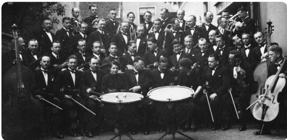
Předchůdci symfonického orchestru učitelů doby autorova dětství, hudebníci ze čtyřicátých let. (Ze sbírek Muzea Dr. Bohuslava Horáka v Rokycanech)

ždý hlas v orchestru má svůj význam a i dobří muzikanti se někdy musí pro druhé nebo třetí hlasy obětovat. Rovněž nezůstalo utajeno, že tento autoritativní ředitel si často v restauraci Na Střelnici přihne plzeňské dvanáctky a pak se ztěžka plouží podél starého hřbitova ulicí Míru, dříve i dnes Plzeňskou až skoro k tehdejší benzinové pumpě, kde bydlel.