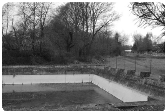
Modernizovaná nádrž na Freiteichu. V pozadí vrby a další stromy obnoveného přirozeného prameniště potůčku napájejícího nádrž.

Druhý den po rozloučení s propouštěnými kamarády si však maminka u lékaře doslova vyplakala i mé propuštění. Na cestu jsem dostal injekci Pendeponu a zadek mě po ní bolel ještě několik týdnů. 17 Celé první prázdniny byly pokažené. Byl jsem pečlivě hlídán, a když mne jednou maminka vzala na procházku k požární nádrži na „Freiteichu“, která dětem sloužila jako koupaliště, záviděl jsem kamarádům, že smějí do vody, a oni se mi naopak posmívali, že tam nesmím a jsem prý rozmazlený. Zkomolené německé názvy byly ve vesnici i v jejím okolí v době mého dětství nadále používány, a to nejen pamětníky, ale i námi dětmi. Byly tak vžité, že snahy učitelů vymýtit je počestvováním