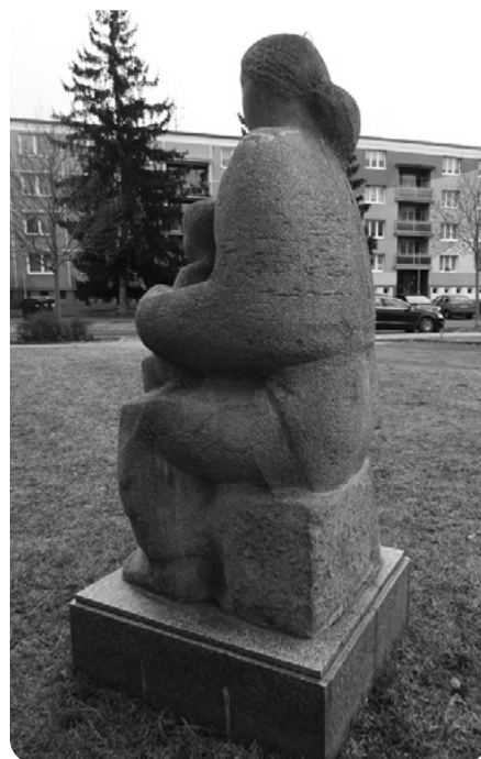
Projev socialistického vkusu na sídlišti v Rokycanech U Václava.