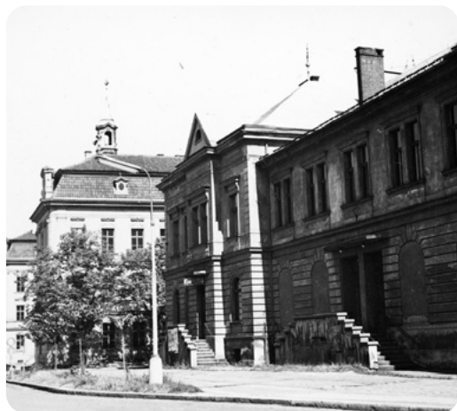
Sokolovna, boční pohled s restaurací z roku 1963. (Ze sbírek Muzea Dr. Bohuslava Horáka v Rokycanech)

Vedle nového domu později otec vystavěl garáž, malý mělký bazén a terasu, pod níž byl sklípek na ovoce propojený s hlavními sklepy; uvnitř domu se modernizovala koupelna, oddělilo se jako samostatná místnost WC a také vznikla podle přání maminky dosti prostorná spíž. Na zahradě otec pořídil matce skleník, postavil kolnu pro králíky a náradí, kde později stál i můj malý motocykl, a ohradil zeleninové záhony hezkou zdobnou zídou, na které bylo možné pohodlně sedět. V blízkosti dokonce vystavěl ozdobnou psí boudu. Vše později přišlo nazmar. Na zahradě byla velmi úrodná půda a dobře se tam