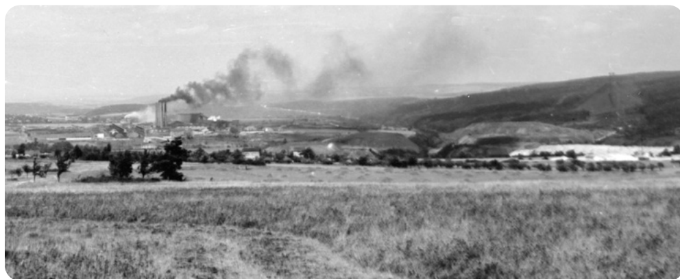
Pohled na ŽDH. V popředí ves Ejpovice, vlevo vzadu Dýšina. Do lesů vpravo navážela přes údolí lanovka černý odpad a vytvářela tam mrtvou horu.