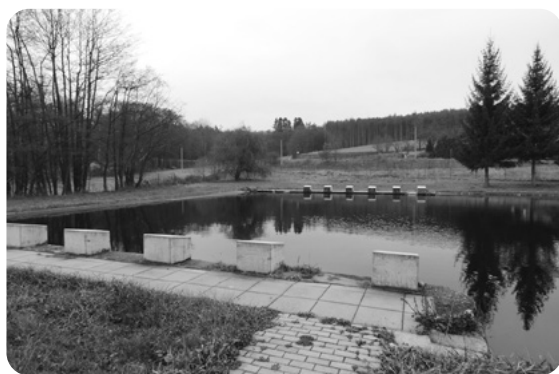
Koupaliště v Příšově, v pozadí silnice vedoucí do Chotikova.

Jel jsem do Plzně ranním autobusem, který tehdy končil až před nádražím ČSD, kde jsem to dobře znal z raného dětství, kdy tam pracovala maminka a s nádražím i stanovišti vlaků mne podrobně seznámila. Koupil jsem si jízdenku a pokračoval dopoledním osobním vlakem dále směrem na Prahu. Stál jsem osamocen v chod-