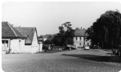
Architektonicky cenný most v Pražské ulici. (Ze sbírek Muzea Dr. Bohuslava Horáka v Rokycanech)

u hostince Na Železné. 34 Pamatuji se, jak jsme se jako kluci na rohu této křižovatky u provozovny holičství a kadeřnictví posmívali kolonám zklamaných nizozemských fanoušků, kteří projížděli kolem po porážce Ajaxu Amsterdam od tehdy silné a slavné Dukly Praha. Jejich vozy a autobusy musely na rohu zpomalit a ostře odbočovat vpravo, kudy vedla tehdy jednosměrná ulice směrem na Plzeň, a to byla chvilka, kdy jsme si je jako mladí fanoušci vychutnávali. Fandil jsem od konce padesátých let Spartaku ZVIL Plzeň, jak se tehdy jmenovala dřívější i dnešní Viktorie Plzeň, přechodně též Škoda Plzeň. Klub během desítek let nejednou sestoupil do druhé ligy a jeho největších úspěchů jsem se ke své velké radosti dočkal až v současnosti, po mnoha desítkách let. Přesto z klubu vzešlo několik skvělých nezapomenutelných hráčů, na které tu a tam s kamarády vzpomeneme. Plzeňský stadion měl již tehdy moderní dvoupatrovou tribunu, která je jeho součástí dodnes. Byl obehnan atletickou dráhou. Pamatuji, jak na ní před jedním z důležitých utkání závodil olympijský vítěz v překážkovém běhu na tři kilometry, belgický policista