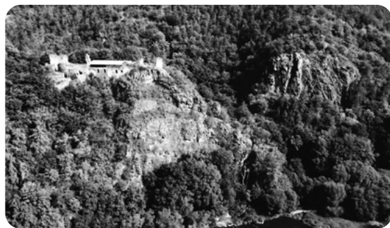
Zřícenina hradu Krašova. Současný stav. (Spolek pro ochranu přírodní rezervace a hradu Krašova,)