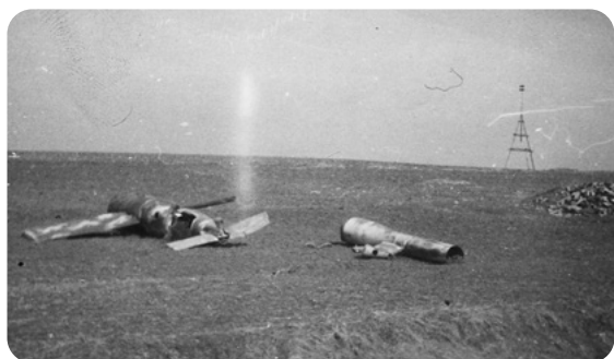
Trosky amerického letadla sestřeleného u Chotíkova.

Počátkem roku 1945, když bylo matce pouhých čtrnáct let, ji německé úřady, které tehdy sídlily ve Stříbře, nasadily nuceně do služby do Města Touškova k bohaté německé selce, jejíž manžel byl nezvěstný na východní frontě. Docházela tam vždy v neděli večer a vracívala se domů v sobotu odpoledne, když přísná selka dovolila navštívit děvčeti rodiče i s tím úmyslem, aby ji doma trochu nakrmili. Podle vyprávění matky byla na ni tato německá selka velmi zlá. Ukládala jí, ještě slabému dítěti, neúměrně těžké práce, špatně ji živila, nic jí v rozporu s německými předpisy neplatila, a když si děvče jednou vzalo trochu marmelády ze spíže, nemilosrdně ji zbilá. Maminka se však selku přesto snažila zčásti omluvit, neboť prý na frontě ztratila manžela i syna. Cestou z Touškova do Chotíkova přes pole a vísku Dolní Vlkyš jednou maminku pronásledoval americký „hloubkař“, donutil ji zalehnout v mělkém příkopu u polní cesty, ale nestřílel po ní. Byl to prý černoš, vypadal v očích děvčete jako čert a letěl tak nízko, že maminka viděla, jak na ni cení bílé zuby. Zda se smál, anebo ji jen strašil, mi nedokázala říci.