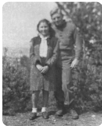
Američtí vojáci a maminka.