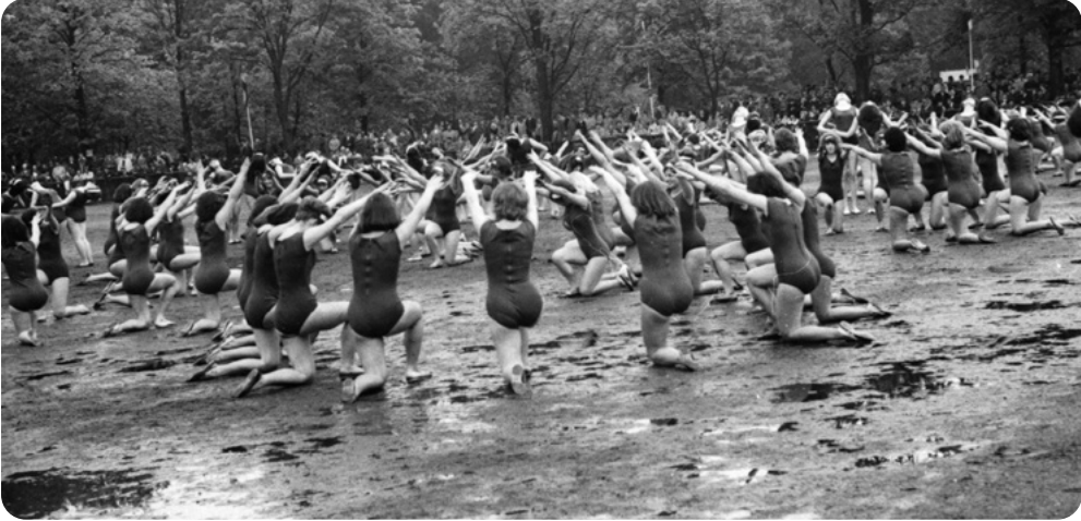
Z bláta do louže musela i děvčata.