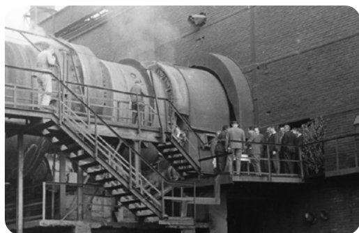
Detail rotační pece.