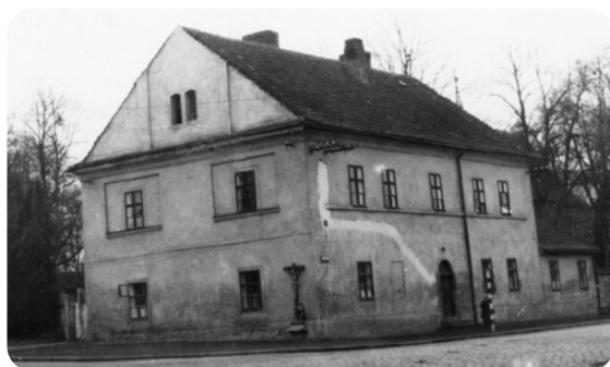
Bývalý špitál u starého hřbitova u křižovatky u Střelnice. Vpravo pokračuje západní část ulice Míru.