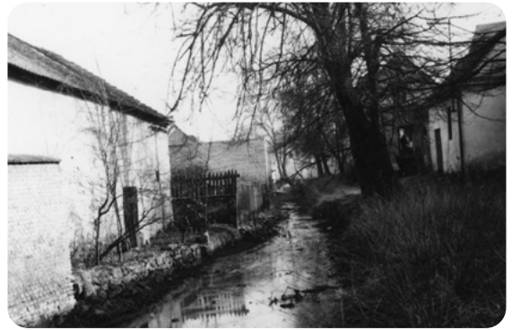
Jedna z jircháren na břehu bývalé Mlýnské strouhy.