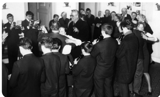
Koncert mladých muzikantů při oslavách MDŽ na rokycanské radnici. Autor u otevřených dveří.