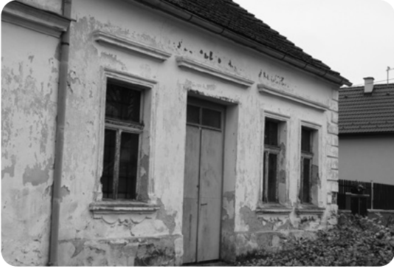
Nevřeň, bývalý hostinec.