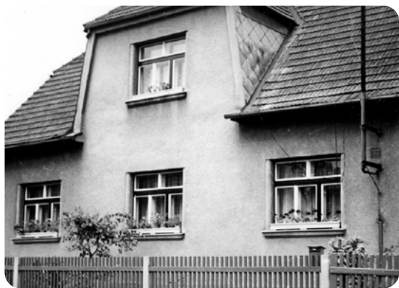
Dům v Horákově ulici, snímek zepředu ze šedesátých let.

hledem počátku šedesátých let bylo možné považovat domek za velmi slušný. Rodiče snili o tom, že se zde po dostavbě podkroví na obytné patro jednou ubytuje moje budoucí rodina a že si tam budou užívat vnoučata.