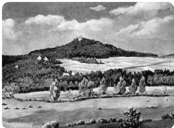
Bývalá hájovna pod Vršíčkem. Jde o nenápadnou budovu vlevo.