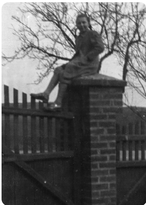
Matka v dětství na pilíři, kde jsem později jako malý chlapec sedával i já.