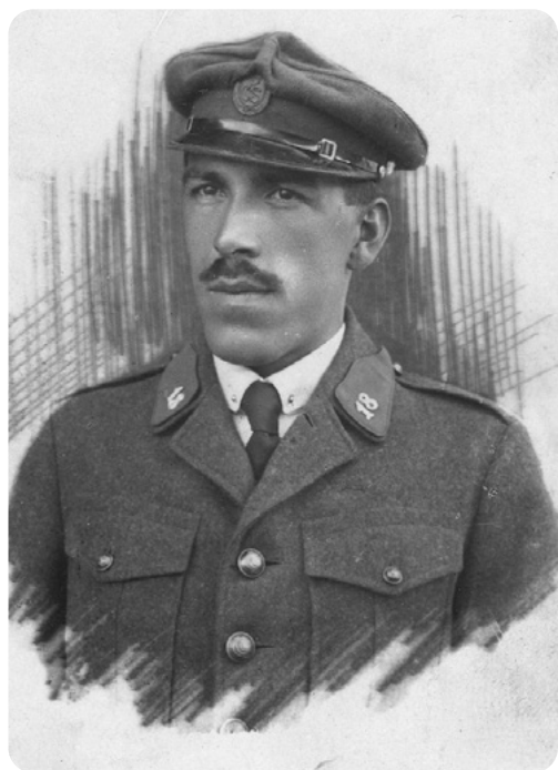
Na detailním portrétu na klopě označení 18. pěšího regimentu.

až překvapivě důsledná a snad trochu nemilosrdná. Promýšlet řešení situací několik tahů dopředu se mi často v životě osvědčilo, ale mnozí, kteří „hrají šachy jen na jeden či dva tahy dopředu“, mi často nerozuměli a poráželi mne jednoduše tím, že „smetávali figurky ze stolu“.