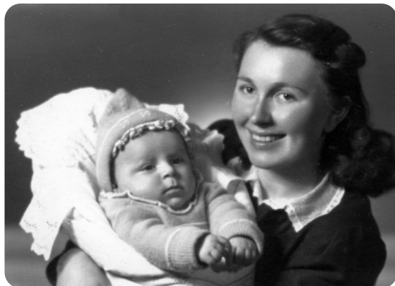
V peřince s maminkou.

Mamince, která za války byla nucena navštěvovat německou školu v Chotíkově, po jejím konci protiněmecky nalaďený režim nedovolil studovat střední školu, a tak se vyučila v družstvu Konzum prodavačkou. Ještě neplnoletou ji