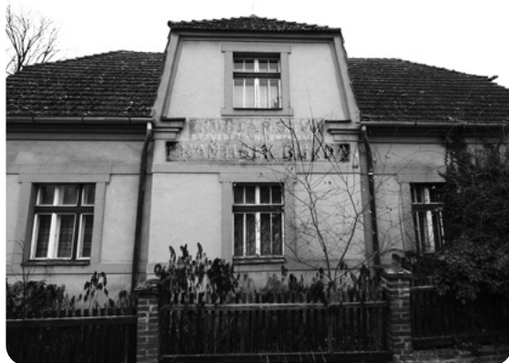
Zašlý nápis na průčelí dědečkova domu: „Truhlářství stavební a nábytkové, František Burda“.