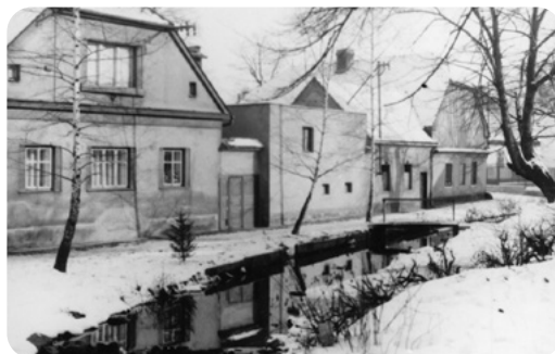
Budovy na pravém břehu Mlýnské strouhy proti Dolním příkopům.