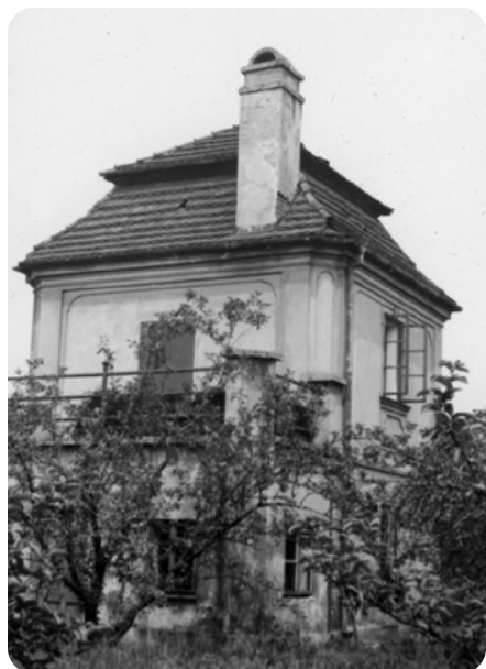
Altán ve Foltově zahradě.

Poté, co otec zbořil starou stodolu bývalého hospodářství, jehož plocha a sousedící