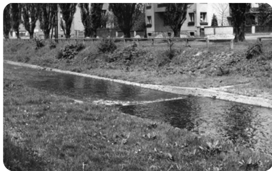
Padráský potok, místo klukovských her. Mezi topoly před druhým domem v pozadí byl plácek pro míčové hry.