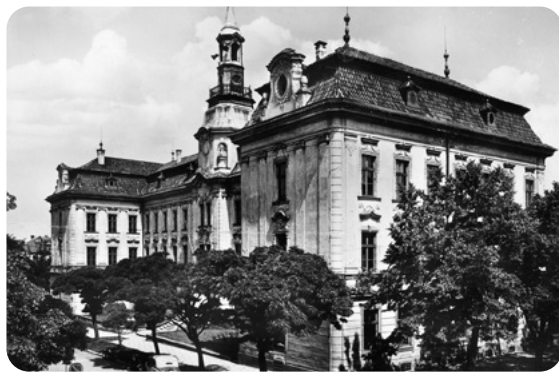
Hlavní budova 11leté střední školy v šedesátých letech.