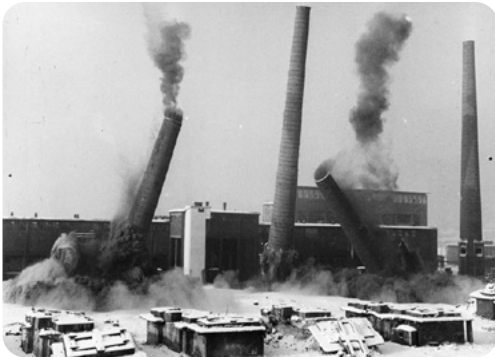
Boření komínů ŽDH. Vychladlé komíny naposledy zadýmaly.

Lesy v okolí továrny šedly a hospodyně nejen v Rokycanech, ale všude ve směru vanoucího větru se bály pověsit prádlo na vzduch, aby brzy nebylo zaprášeno. Tak to trvalo několik let, až se konečně zjistila obrovská ztrátovost tohoto neefektivního podnikání. Národní podnik byl přejmenován z Železorudných dolů a hrudkoven (ŽDH) na Rudné a nerudné doly (RND), výroba železa hrudkováním byla zastavena a podnik posléze restrukturalizován. Trvalo velmi dlouho, než byla hora černé odpadové strusky využita jako pomocný stavební ma-