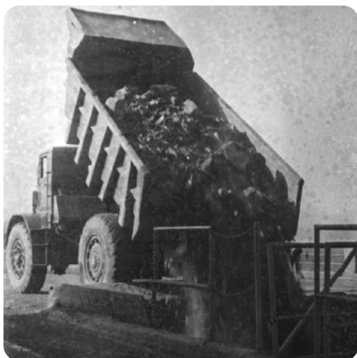
Navážení rudy sovětskými automobily z dolu v Klabavě do továrny.