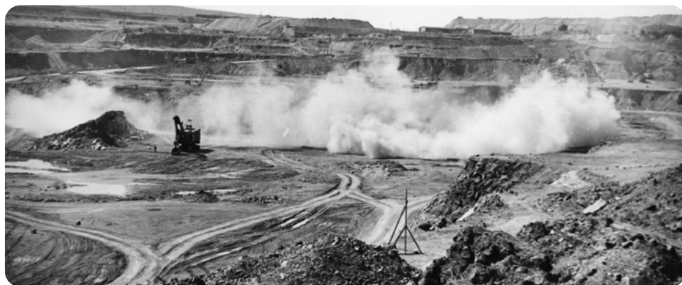
Zničená niva řeky Klabavky hlubokým rudným dolem níže vsi Klabava.