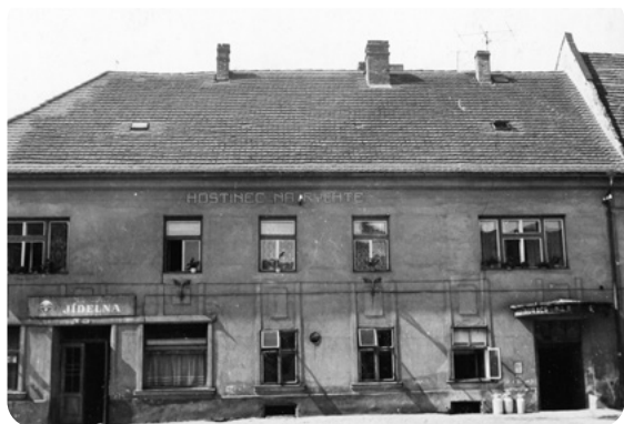
Výše zmíněné rokycanské hostince. Na Plevně, Hradčanech a Rychtě.

jsme prošli i Strání a hřbitovem a vraceli se domů, byl už trochu unaven. Bylo mu již 70 let.