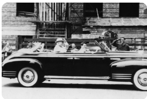
Nikita Sergejevič Chruščov v otevřené Čajce. Za ním sedí Antonín Novotný.

Autentickou, a přitom poněkud komickou osobní vzpomínku mám na Nikitu Sergejeviče Chruščova, významného, byť nepochybně tragikomického sovětského státníka. Jak známo, při své památné návštěvě USA na konci padesátých let se vzrůstem malický Nikita Sergejevič shlédl v pěstování vysoké kukuřice a prosazoval pak tuto plodinu ve všech zemích tehdejšího socialistického tábora. V Československu údajně dosáhl jednoho z nejlepších výsledků při jejím pěstování JZD Bušovice na Rokycansku. Tehdy se sice mnohé hospodářské výsledky falšovaly, což jsem již zmínil v souvislosti s výsledky vrtů u Klabavy, ale Chruščov informaci československých soudruhů zemědělců uvěřil a rozhodl se tomuto JZD da-