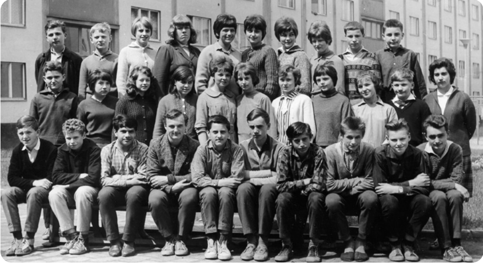
Osmá třída ZDŠ Za Radnicí v roce 1965. Autor v zadní řadě první zprava.