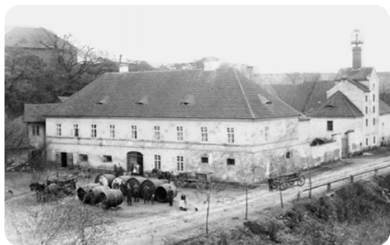
Bývalý Městský pivovar, později i dnes prádelna.