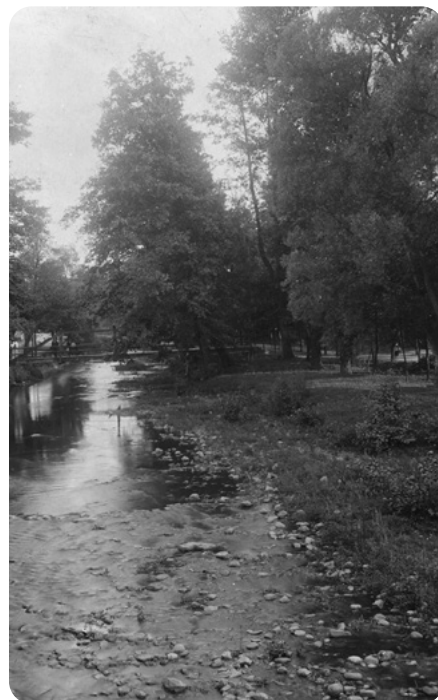
Pohled od železničního viaduktu do Alejí k lávce přes Padrťský potok u bývalého hostince Pod Starou hutí, lidově Pod Kajdou.