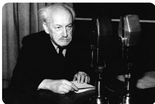
Nejedlý jako duševně chátrající stařec při jednom ze svých památných směšných rozhlasových projevů.