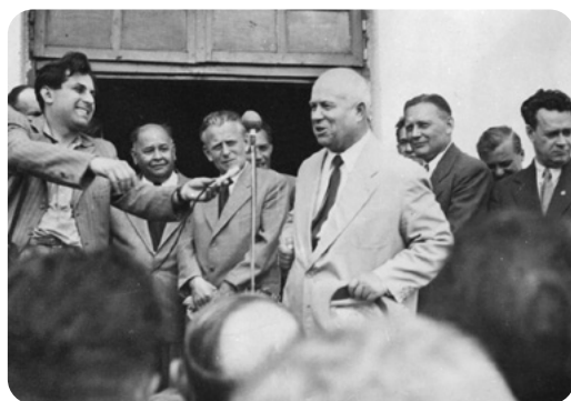
Vítání Nikity Sergejeviče a proslov u kravína v Bušovicích.