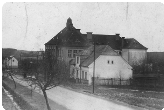
Dědečkův dům a firma vedle školy a stav zástavby kolem karlovarské silnice v roce 1942 i později v padesátých letech.