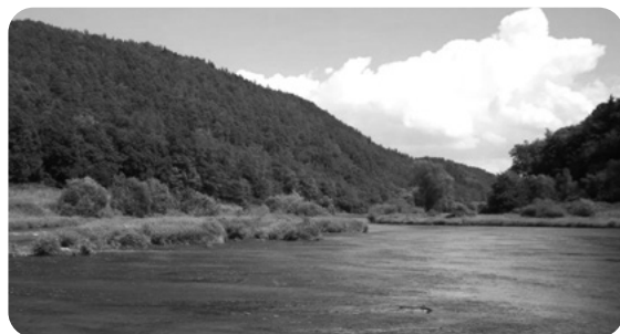
Mělčina laguny Berounky, kterou jsme jako děti přebrodili. Vpravo louka, kde jsme tábořili, vlevo silnější proud řeky.