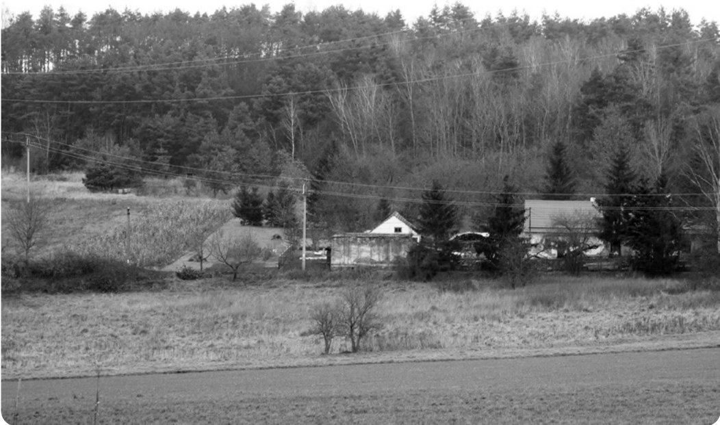
Přehledný pohled na chotikovskou pohodnici a okolí. Vpravo cesta od Dolní Vlkýše a Malesic, nalevo nahoře začínala pískovna, jejíž obrovská jáma je dnes zavezena odpadem a stojí zde spalovna Plzeňské teplárenské.

Miloval jsem zejména kůštecký les. Od roviny při karlovarské silnici se směrem k zapadlé vesničce Kůští zařezávala do svahu, obráceného k jihozápadu, jedno vedle druhého nehluboká údolíčka s mírnými svahy, kterým jsme říkali „jámy“. V každé z nich převažoval v jistém měsíci od jara do podzimu jiný druh hub, a tak se v různých obdobích do té či oné jámy chodilo sbírat je skoro najisto. Rodina používala své- rázné názvosloví hub, takže jsem byl později velmi překvapen tím, že jejich oficiální názvy jsou nezdárka zcela jiné.