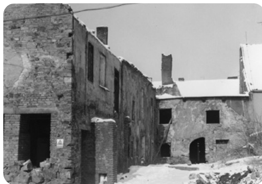
Domy v takzvané cikánské čtvrti a jejich bourání.