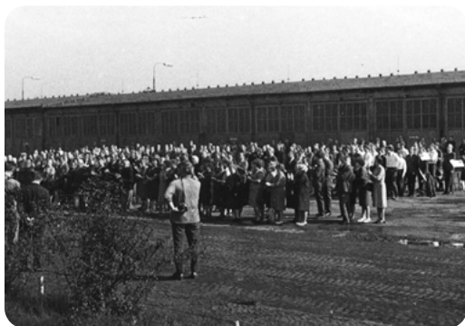
Slavnostní otevření hrudkoven. Shromáždění před továrnou.