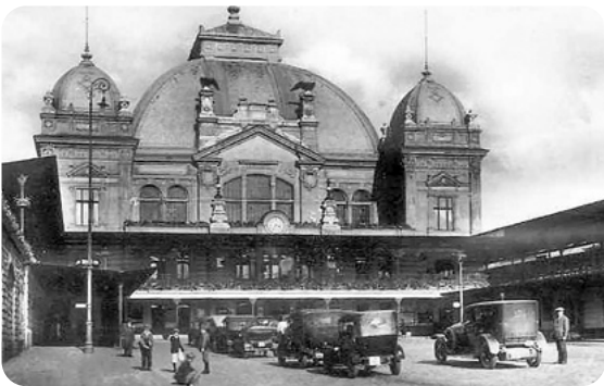
Plzeňské hlavní nádraží, za socialismu Gottwaldovo.

pak učinili vedoucí malého krámků v nedaleké Nevřeni. Tam pak prodávala zboží všeho druhu a dojížděla tam z Chotítkova od svých 17 let na starém kole. Maličký krámeček lze ještě dnes v Nevřeni rozpoznat podle zrezivělé plechové stahovací rolety při jízdě vesnicí shora od karlovarské hlavní silnice vpravo. Poprvé jsem jej viděl ve svých pěti letech, když jsem šel s babičkou pěšky do tamního hostince, kde bylo také možno objednat palivo, aby tam objednala uhlí na příští zimu. Tehdy ale již maminka v krámků neprodávala. Dostala místo nepříliš dobře placené literistky, tedy pomocné úřednice u ČSD v Plzni, nejprve na Správě drah v Purkyňově ulici, později v samotné budově hlavního nádraží.