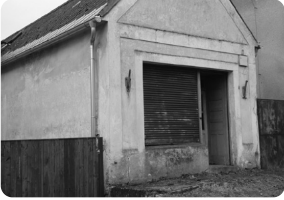
Krámeček v Nevřeni, někdejší působiště maminky v dívčích letech.