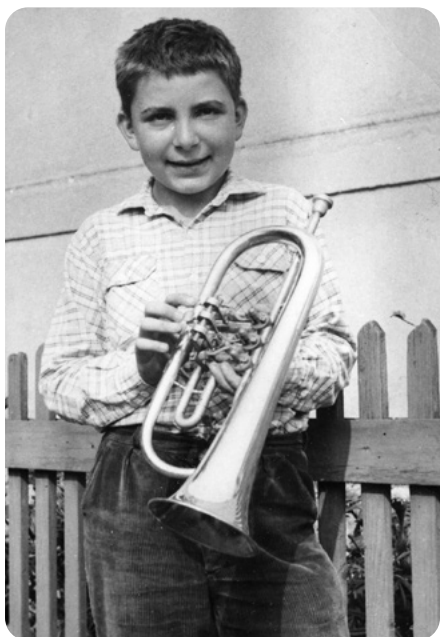
Na prázdninách u babičky s křídlovkou.

sátých letech v době normalizace, přečkaly dokonce i proticírkevní řádění komunistů a jejich celostátní akce na počátku padesátých let. Jeden zbytek takového křížku mám na památku uschován ve sklepe svého domu. Zachránil jsem jej v osmdesátých letech v Chotíkově na černé skládce. Ještě v šedesátých letech, když jsem pobýval u babičky na prázdninách, jsem často chodil ke křížku v polích ve směru na Kůští cvičit hru na křídlovku, když už babička nemohla má usilovná cvičení stupnic a Kolářovy školy, podle které nás v Hudbě mladých, o níž bude ještě zmínka, kapelník Josef Martiník st. vyučoval, poslouchat.