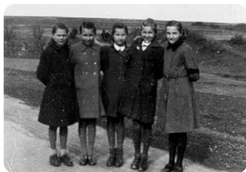
Kamarádství děvčat obou národností, rok 1943. Maminka druhá zleva, 12letá.