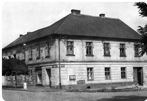
Bývalý hostinec Na Šumavě.