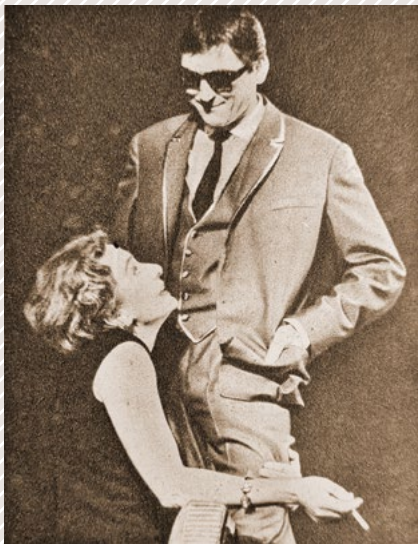
Štefan Kvietik ako Nick a Mária Prechovská ako Martha

Vianočné predstavenie uvedené 25. decembra od Samuela Becketta – Šťastné dni , o manželskej dvojici, ktorá spomína na tie krásne šťastné časy a popritom sledujeme, ako plynie ich každodenný život. Režisér obsadil do hlavných úloh Máriu Prechovskú a Braňa Koreňa. Peter Mikulík siahol po tejto hre ani nie štyri roky po jej premiére v divadle Cherry Lane v New Yorku aj vďaka jeho nesmiernej literárnej rozhladenosti.