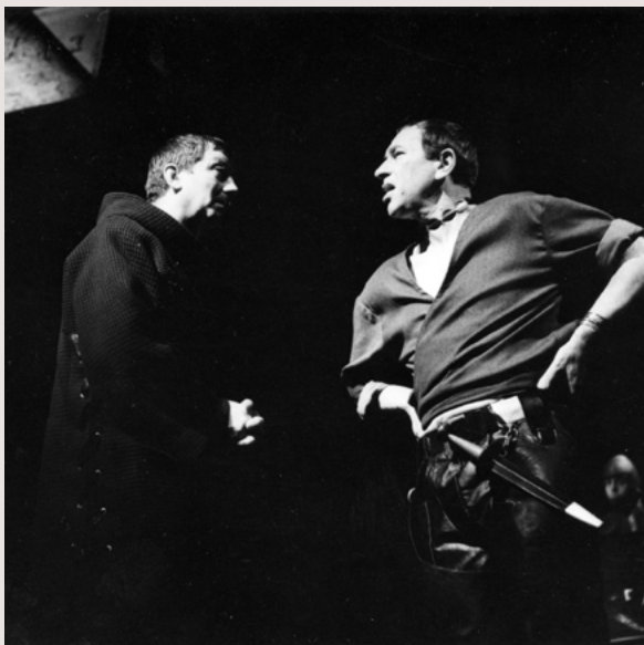
Diabol a Pán Boh

Na záver roka – 18. decembra – pripravila činohra SND inscenáciu v troch dejstvách Diabol a Pán Boh podľa francúzskeho filozofa a spisovateľa, hlavného predstaviteľa existencializmu – Jean-Paula Sartra. Goetz, hlavná postava, krutý vojak, chce dokázať svoju prevahu nad Bohom uskutočňovaním najhoršieho zla. Vypaľuje mestá, kruto ničí životy. Jeho oponent kňaz Heinrich mu hovorí, že konať zlo je ľahšie ako konať dobro,