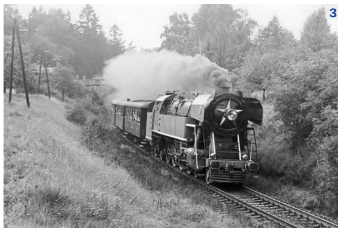
3 Papoušek 477.043 odváží návštěvníky výstavy lokomotiv v Lužné zpět do Prahy. Ruda 12. 9. 1981.

na cestu údolím Labe, aby se v Kralupech rozdělil a za velkého zájmu fotografů jeho část pokračovala po staré Buštěhradské dráze na Kladno. V depu dobrala mašina vodu, otočila se na trianglu a pokračovala se svými vozy do Lužné. Tady si Pětasedma počkala až do září. Zámečníci luženské správárny ji tu ještě rozpojili od tendru, aby mohla být uschována v rotundě.