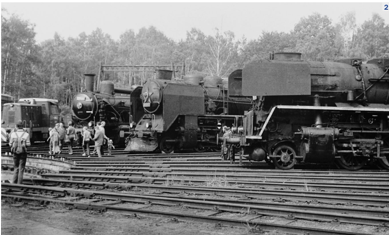
2 Pohled na vystavené lokomotivy 434.2186, 534.0323 a 556.0238. Lužná 12. 9. 1981