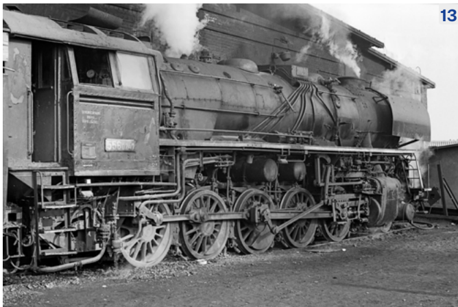
13 První živá parní lokomotiva na kterou jsem ve své kariéře vylezl, 556.0242 v depu Kladno 14. 2. 1981.

kýžené hodiny, soudružka učitelka nám sdělila, že již parní lokomotivy nejezdí a že v depu na Kladně mají již jen jednu a tou jen vytápí, aby nebylo zdejšími pracovníkům zima. Psal se rok 1977, snažil jsem se proti tomu protestovat, ale to bylo asi to jediné, co jsem tehdy mohl dělat. Nebyla to samo sebou pravda, kladenské depo ještě v té době parní lokomotivy na výkony nasazovalo. Pozoroval jsem to během výletů na kole, které jsme podnikali s partou kamarádů z našeho domu.