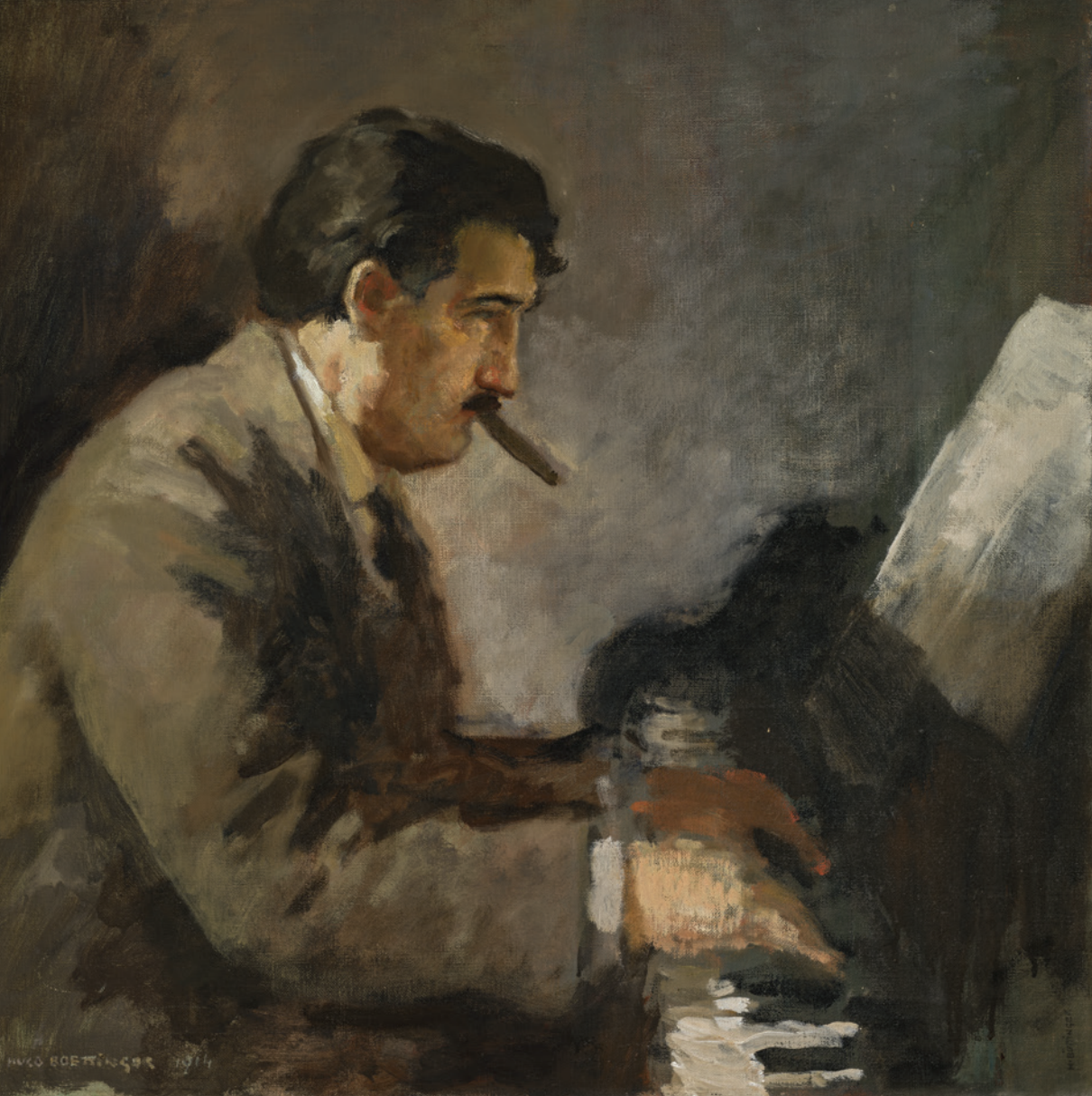
1. Josef Suk, olej na plátně, 1914