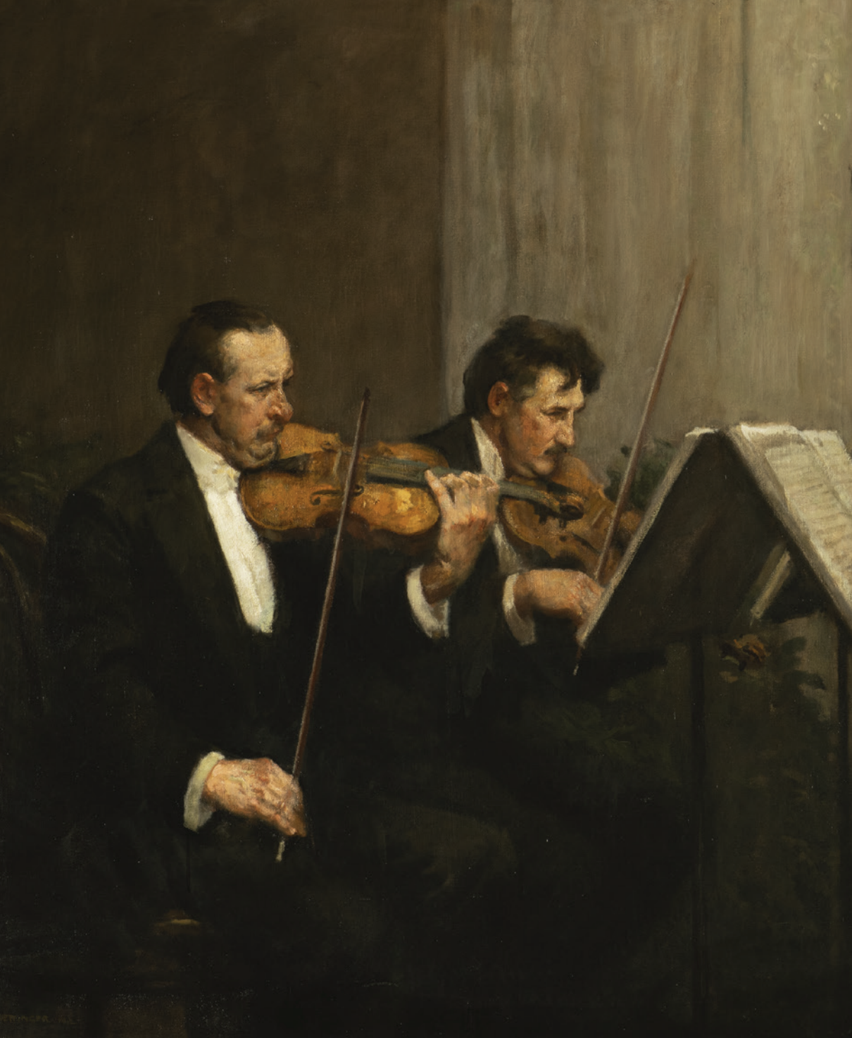
4. České kvarteto ve složení Karel Hoffmann, Josef Suk, Jiří Herold a Hanuš Wihan,