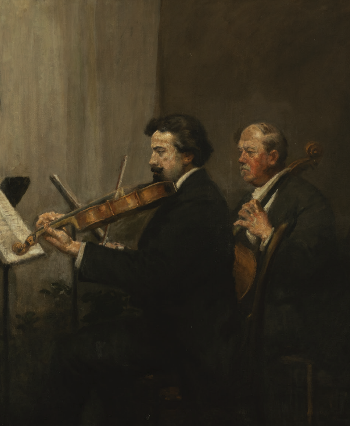
olej na plátně, 1912 (Pražská konzervatoř)