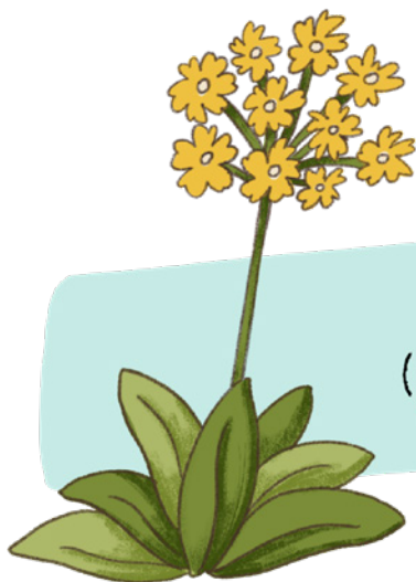
PETRKLÍČ (PRVOSENKA JARNÍ)

Hm, jestli se budu loudat, budu to já, kdo půjde z kola pryč. Děti se rozutečou, na povídání o jaru nebudou mít čas, pomyslel si děda Orlík a natáhl krok, aby se partě školáků alespoň trochu přiblížil.