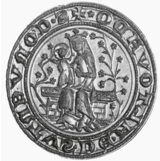
[13] Konventní pečeť , symbol shromáždění mnichů, se stala v cisterckých kláštorech povinností po vydání Obnovených statut řádu v roce 1335. V archivu vyšebrodského kláštera se zachovala mimořádná památka, původní razidlo ze 14. století.

dát soukromé církevní instituce potvrzovat panovníkem. A v roce 1264 nebyl důvod, proč by král svůj souhlas odepřel. 83