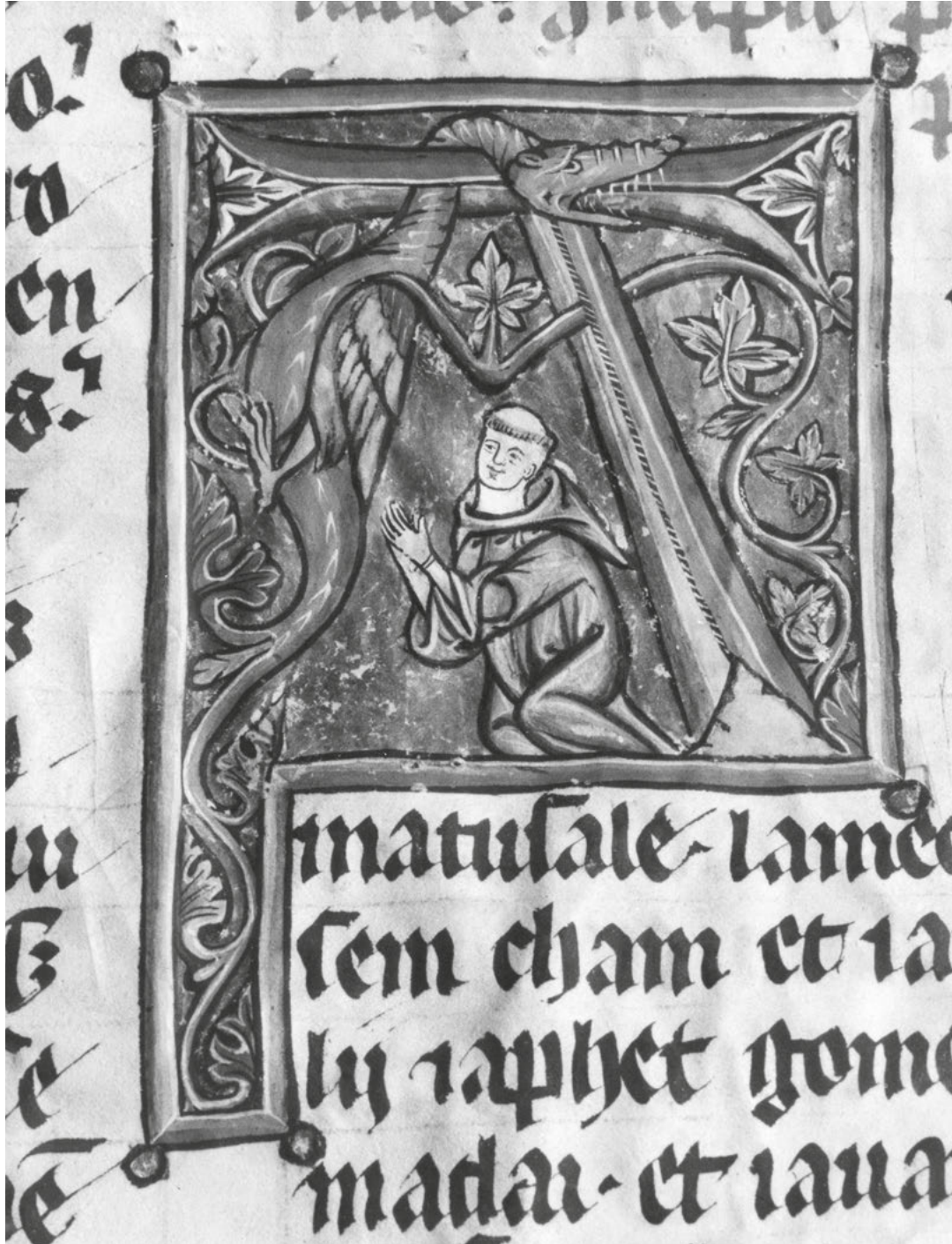
[12] Vizitace uskutečňované ve vyšebrodském klášteře nabádaly mnichy k řádné účasti na chórových modlitbách. Vyšebrodská bible, písmeno A s klečícím benediktnem a drakem.