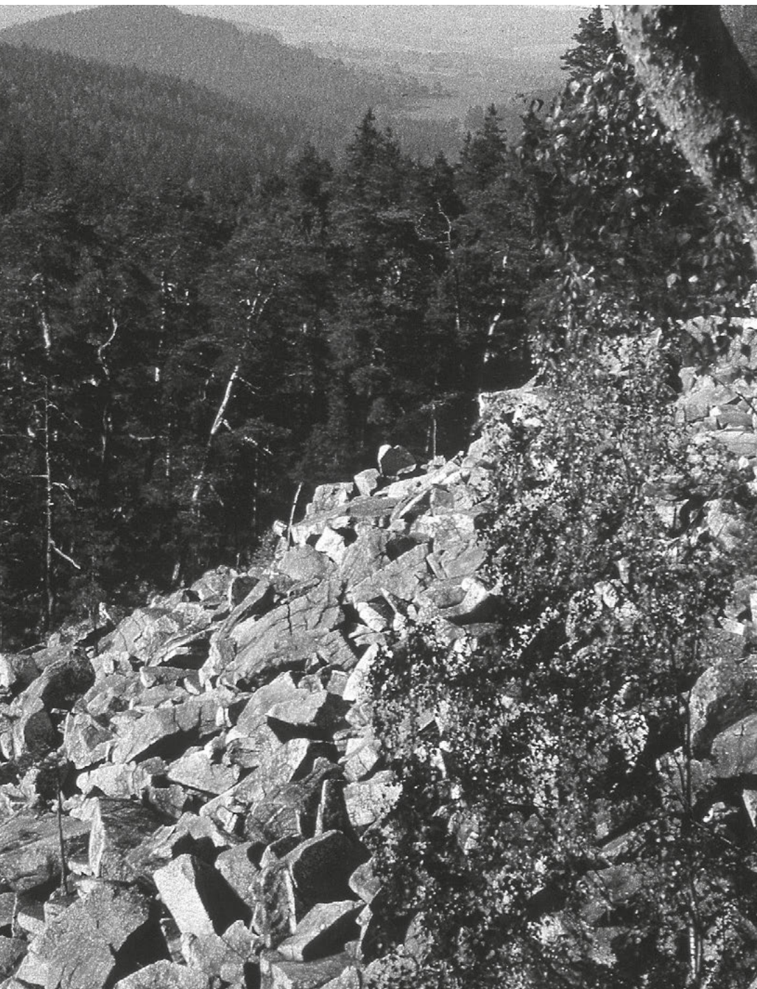
[4] Hranici klášterního lesa vymezovala také Čertova stěna. O působivosti tohoto kamenného pole svědčí jeho pojmenování v zakládací listině vyšebrodského kláštera, kde je označen jako „Strassidelnik“.