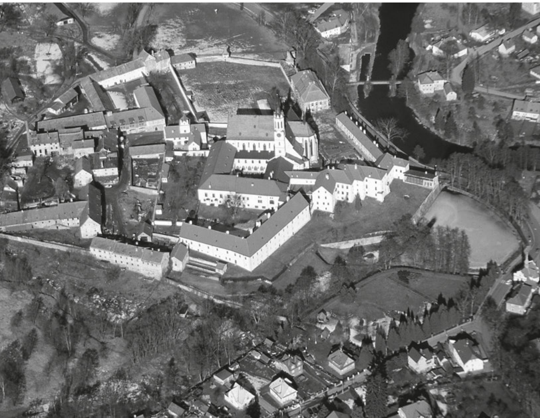
[1] Vyšebrodský klášter leží na břehu Vltavy v lesnaté pošumavské krajině. Letecký snímek kláštera a jeho nejbližšího okolí.

roku 1260 byl jmenován zemským hejtmanem ve Štýrsku. Za prokázané služby jej Přemysl II. Otakar odměnil udělením hrabství Raabs, ležícím v rakouském Waldviertlu.