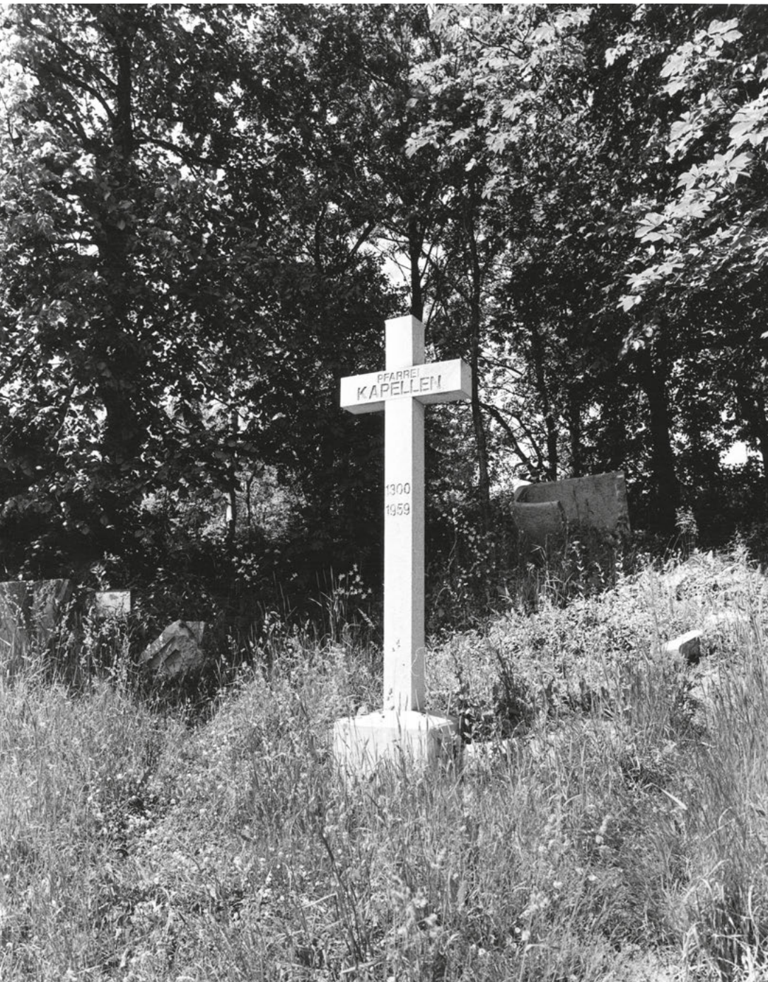
[15] Prostor tzv. Klášterního lesa. V rámci vyšebrodské kolonizace zde bylo založeno pravděpodobně devět vesnic. Po druhé světové válce se tato oblast dostala do tzv. hraničního pásma. Všechny vesnice, které se zde nacházely, včetně farního kostela v obci Kapličky (Kappeln), srovnala v roce 1959 armáda se zemí.