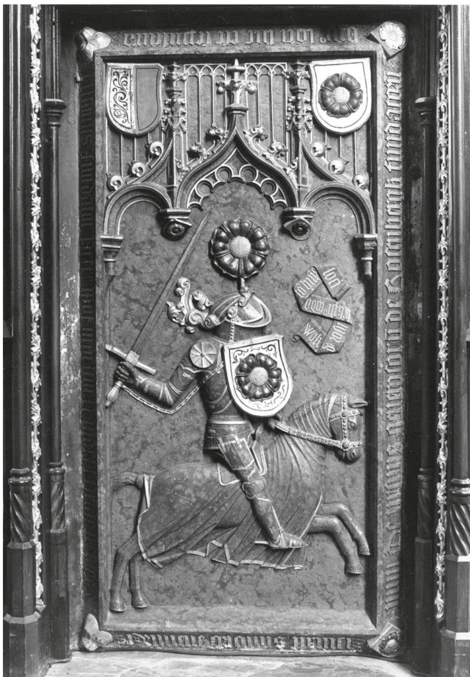
[5] Pevné vztahy pojily vyšebrodský klášter s jeho zakladatelským rodem, pány z Rožmberka. Tyto vazby trvaly po celý středověk až do vymření rodu v roce 1611. Rožmberkové si Vyšší Brod zvolili za místo svého posledního odpočinku. Náhrobek rožmberského rodu v konventním kostele ve Vyšším Brodě znázorňuje zakladatele opatství Voka z Rožmberka.