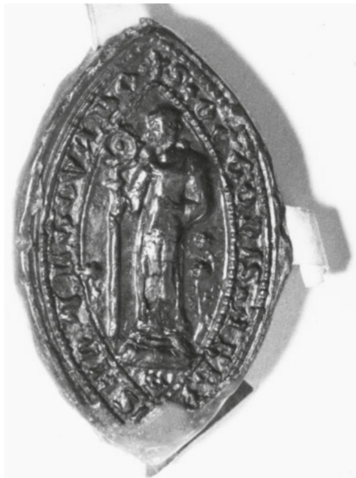
[14] Pečeť opata Oty III., který spravoval vyšebrodský klášter v letech 1373–1380.

Na rozdíl od předchozích dvou opatů Jindřich II., zvaný Pukasser, vedl vyšebrodský klášter plných 15 let (1358–1373). I v této době pokračoval rozvoj klášterního majetku, i když častěji než půdu dostávali nyní vyšebrodští cisterciáci od svých dobrodinců platy. O dobrém stavu klášterního hospodářství za Jindřicha II. svědčí výsledek vizitace provedené poté, co Jindřich II. na svůj úřad rezignoval. Uvádí se v ní, že klášter nemá žádné dluhy. 104