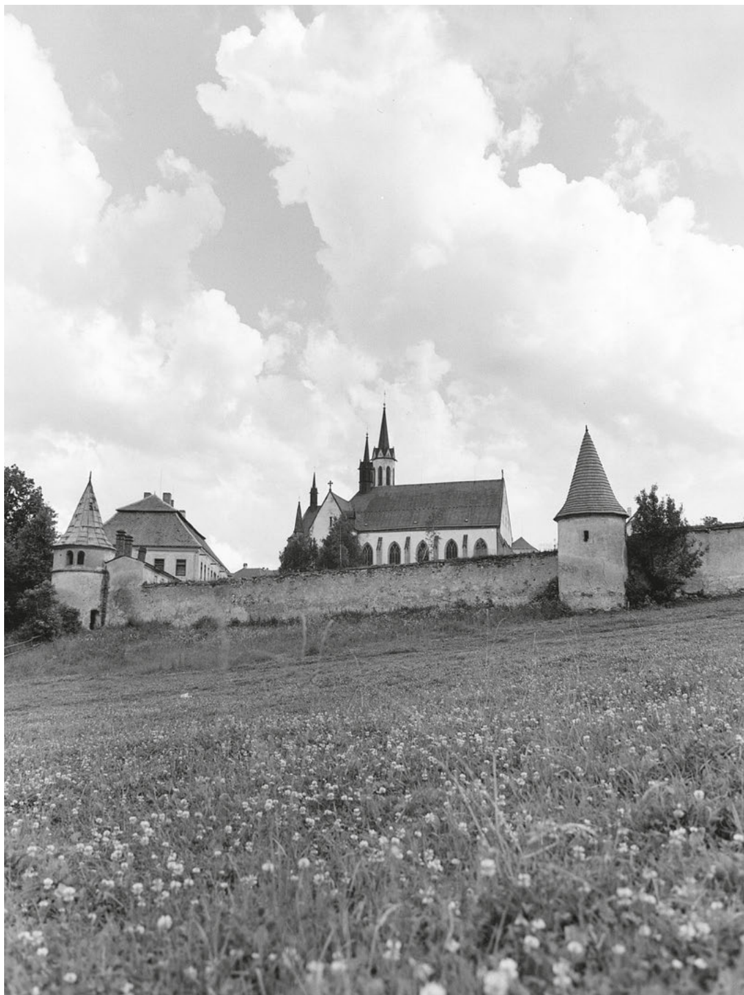
[8] Opevnění vyšebrodského kláštera s hradbou a věžemi.