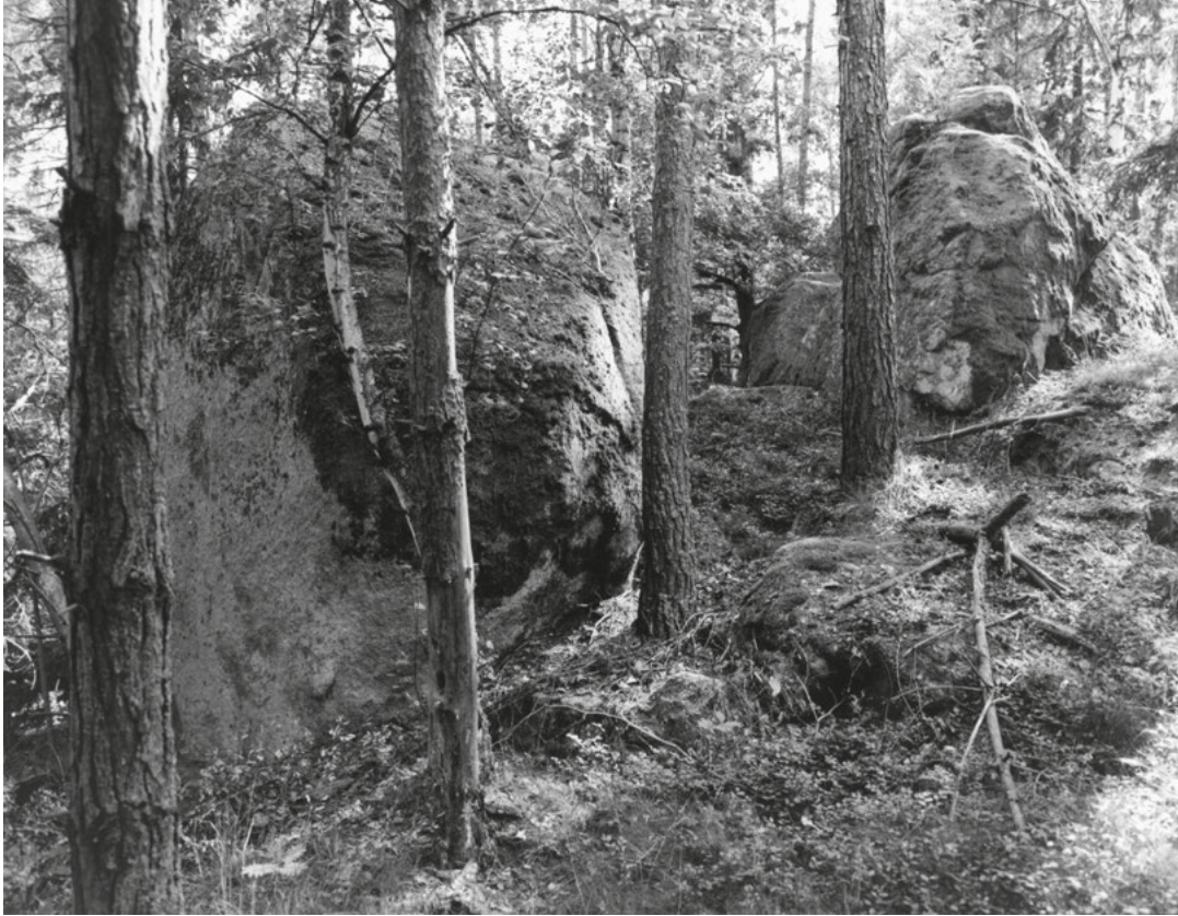
[3] Les s obrovskými žulovými kameny bezprostředně nad klášteřem. Podobně nehostinně asi vypadal i areál dnešního opatství v polovině 13. století, když mniši přišli do Vyššího Brodu.

od Vyššího Brodu, při dnešní hranici s Rakouskem. Převážně horský terén znemožňoval jeho větší hospodářské využití; pouze příhodnější část se v budoucnu stala místem klášterní kolonizace. 11