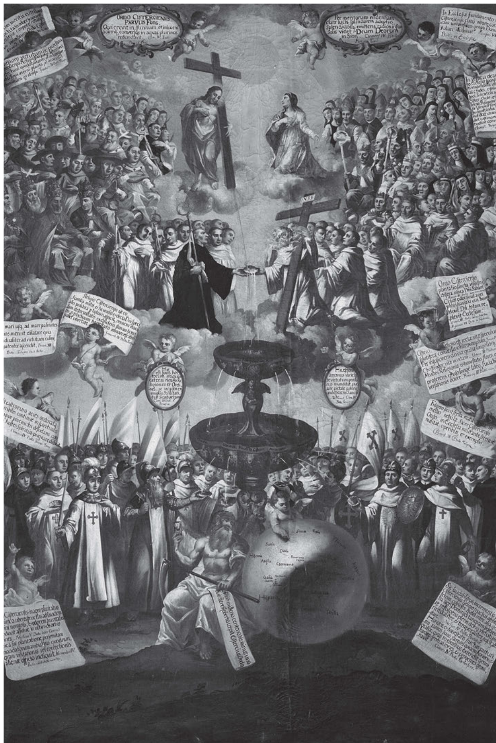
[7] Vznik a rozšíření cisterckého řádu v pojetí neznámého barokního řádového malíře. Sedlec, katedrála.