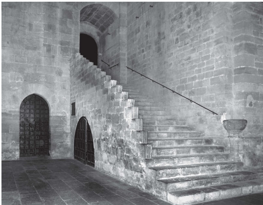
[13] Dormitář s přízemím spojovala dvě schodiště. Noční vedlo do kostela, aby se mniši za tmy mohli snadno dostat na vigilie, denní do ambitu. Santes Creus, noční schodiště, pohled z kostela.

Odpočinek byl v létě rozdělen do dvou částí. Denní (siesta) se odehrával po obědě a trval asi dvě hodiny. Pro spánek byl vyhrazen čas od osmi večer do necelých dvou hodin ráno. V zimě během dne mniši odpočinek neměli, zato noční klid začínal dříve, v nejkratších dnech roku již po čtvrté hodině a trval až asi do čtvrt na dvě v noci.