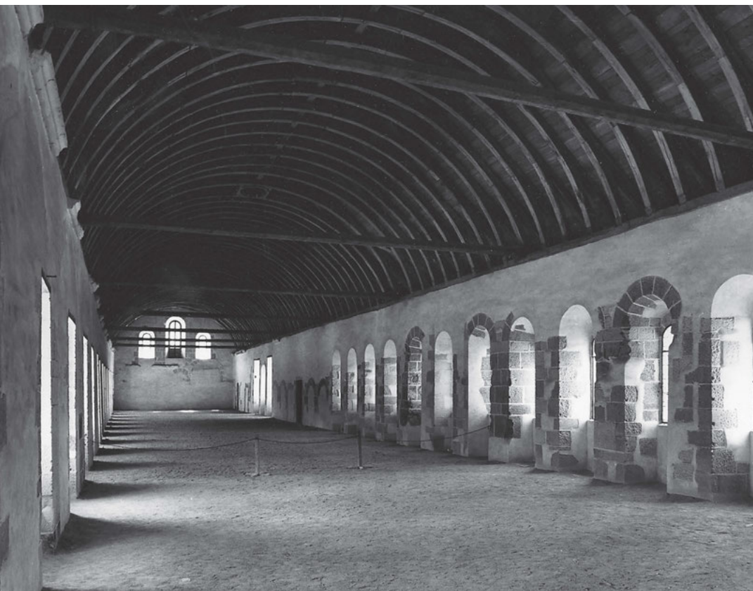
[12] Mniši spali ve společném dormitáři, jenž byl umístěn nad východním křídlem konventu. Dormitář ve Fontenay, 12. století.

V létě byl čas na práci rozdělen do dvou úseků. V zimě mu náležela většina světlé části dne od tercie po nony, pouze s přerušáním na polední hodinky a odpočinek. Mniši spolu s laickými bratry pracovali na polích, pečovali o dobytek a podíleli se na provozu řemeslných dílen. Dále mniši drželi týdenní služby v klášterní kuchyni. Na rozdíl od konvršů nespočívala práce mnichů pouze ve fyzické činnosti, ale zahrnovala také intelektuální povinnosti, jako přepisování a výzdobu knih. Duchovní četbě ( lectio divina ) se mniši věnovali v létě po terciích, v zimě ráno po vigíliích a pak před nešporami. Každý večer po nešporách se drželo tzv. collatio , společná četba. Svůj název tato liturgická část dne dostala podle jednoho z děl Jana Cassiana, kterého v tuto dobu doporučuje číst řehole sv. Benedikta. 52