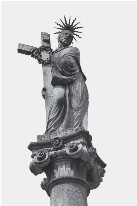
[5] Sv. Bernard z Clairvaux, velký reformátor, zakladatel cistercké spirituality, nejvýznamnější představitel cisterckého řádu, uctíváný od 12. století jako světec. Barokní socha z plaského kláštera.

I krátká ukázka z listu, jež zaslal knížeti Vladislavovi II., dosvědčuje Bernardovu neobyčejnou výmluvnost. Tě neodolal ani český kníže. Také on přijal kříž a jako mnoho jiných se vydal roku 1147 na cestu ke Svatým místům. Neúspěch 2. křížové výpravy byl také prohrou Bernardovou a její stín dopadl i na cistercký řád. 14