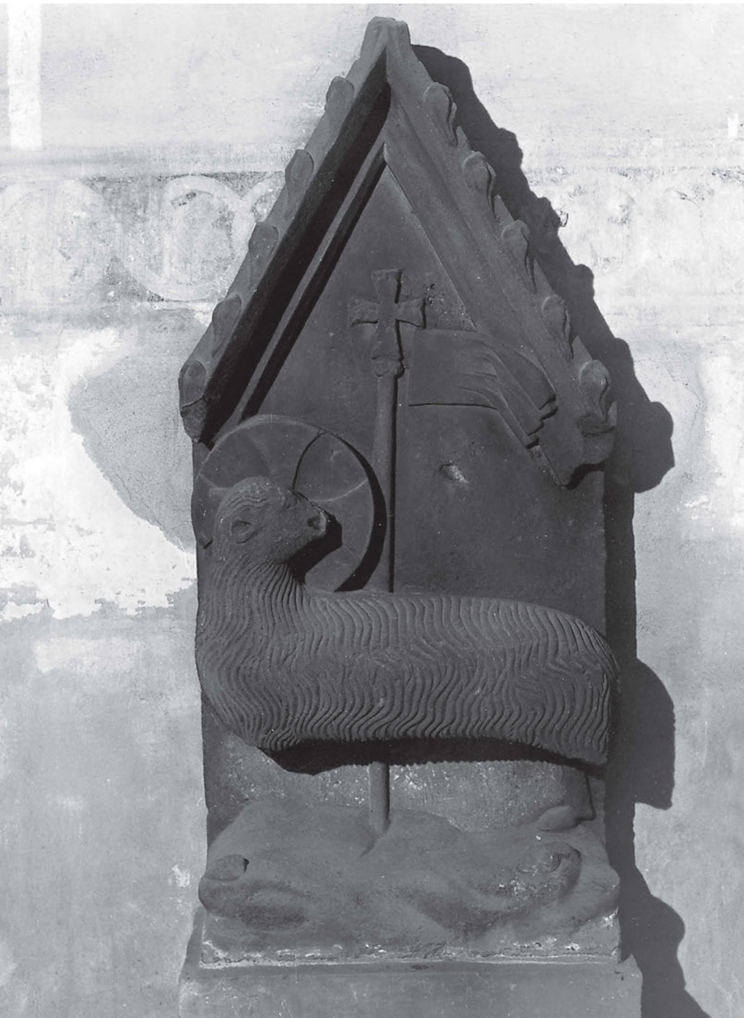
[1] Beránek Boží , symbol zmrtevšího Krista. Osecký klášter cca 1280.