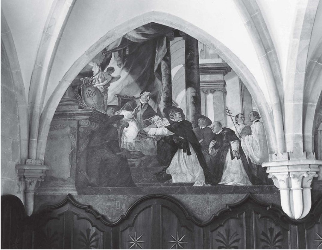
[4] Papež Kalixt II. potvrzuje cistercký řád. Barokní freska v kapitulní síni osekého kláštera.

pouze jako počátek cesty k dokonalosti a uvádí možnost hledání dalších cest ke zlepšení mnišského života. 10