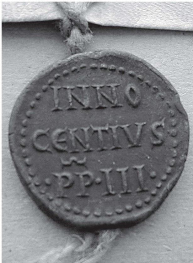
[19] Doba papeže Inocence III. přinesla ochlazení mezi cisterckým řádem a papežstvím. Pečeť Inocence III. na listině oseckého kláštera z roku 1207.

lidé, kteří sídlili na klášterní půdě, směli přijímat svátosti v klášteře a nebyli povinni se v těchto záležitostech obracet výhradně na příslušného faráře. Alexandr IV. též předal opatům jurisdikci nad jejich poddanými. 75