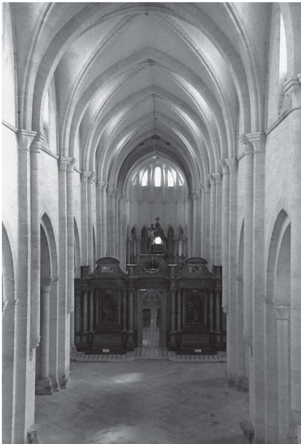
[16] Interiér kostela v Pontigny (12. století) s barokním letnerem. Letner odděloval část chrámu, kde se bohoslužeb účastnili mniši, od prostoru vyhrazeného pro konvrše.