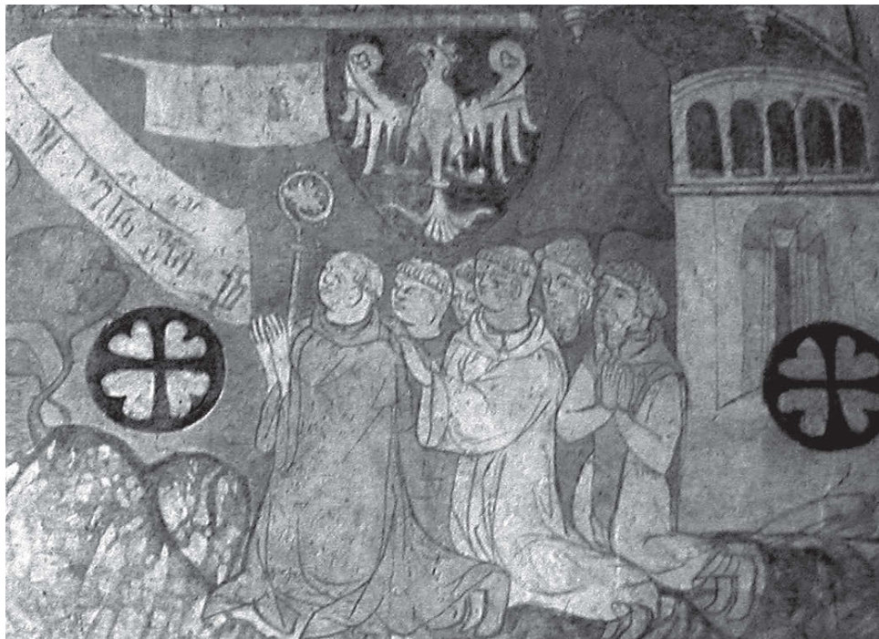
[11] Konvrši se od mnichů lišili i svým zevnějškem, neboť na rozdíl od mnichů si nevyholovali tváře. Odtud se někdy nazývali také fratres barbati , bradatí bratři. Opat, mniši a konvrši. Fresky v kapli sv. Jakuba ve velkopolském opatství v Łądu. 13. století.

novém poledním klidu se opět rozezvučel zvon oznamující počátek odpoledních hodin, které se nazývaly nony. Po nonách se cisterciáci věnovali až do večera manuální činností. Při západu slunce probíhala večerní bohoslužba, nešpory. Po krátké večeri následovaly poslední modlitby – kompletář ( completorium ), které uzavíraly denní cyklus. Kompletář končil zpěvem antifony k počtě P. Marie Salve Regina .