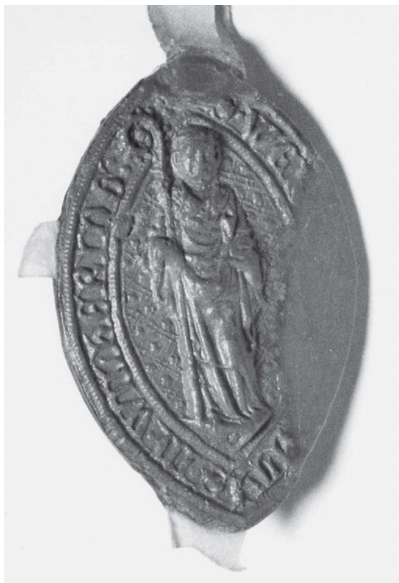
[10] Opat, nejvyšší představitel cisterckého klášteřa. Pečeť opata wilherinského.

cí v opatství vypovídá např. sedlecká listina z roku 1345, kde jsou za sebou jmenováni následující hodnostáři: opat, převor, podpřevor, celerář, fortnýř, kustod, zpovědník v podřízeném ženském klášteře, komorník a pokladník. 47