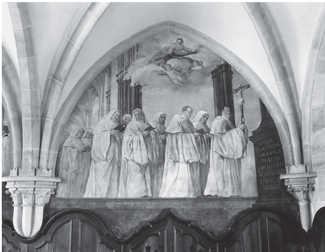
[8] Cisterciáci v bílém chórovém plášti. Barokní freska v kapitulní síni osekého kláštera.

Filiační systém přičleňoval kláštery k řádu bez ohledu na územní členění ať již světského, nebo církevního charakteru. Mateřské domy mohly mít svá štípení v jakékoli katolické zemi a jejich filiace mohly z hlediska církevně-správního spadat do různých diecézí.