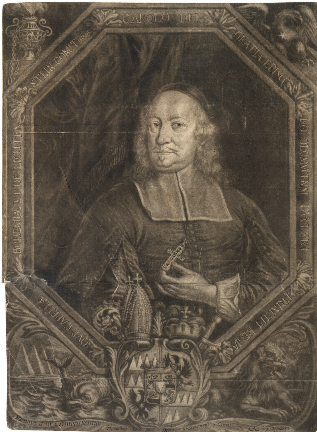
4 Justus van den Nypoort, Portrét biskupa Karla z Lichtensteinu-Castelcorna, z alba Die Fürs-Bischofliche Olmucische Residentz-Stadt Cremosier... Lust- Blum- und Thier-Garten , Kroměříž 1691, mezzotinta, papír, Arcibiskupství olomoucké.