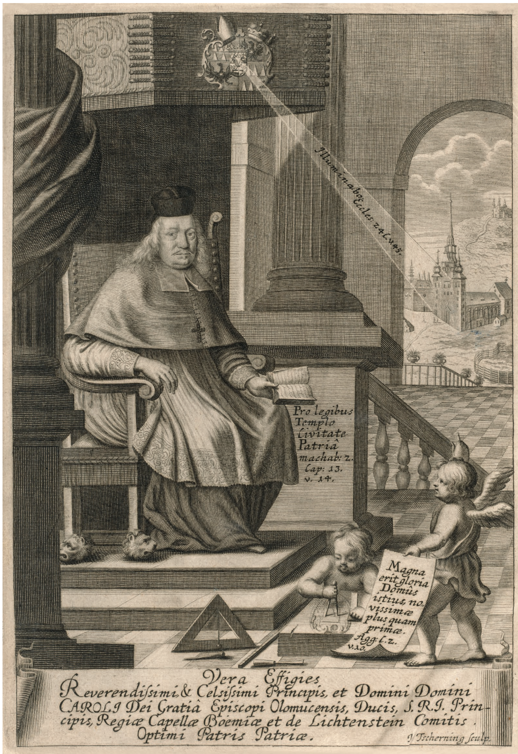
1 Johann Tschering podle Martina Antonína Lublinského, Vera effigies biskupa Karla z Lichtensteinu-Castelcornu, frontispis z knihy Missæ Sanctorum , 1693, mědiryt, papír, Arcibiskupství olomoucké.