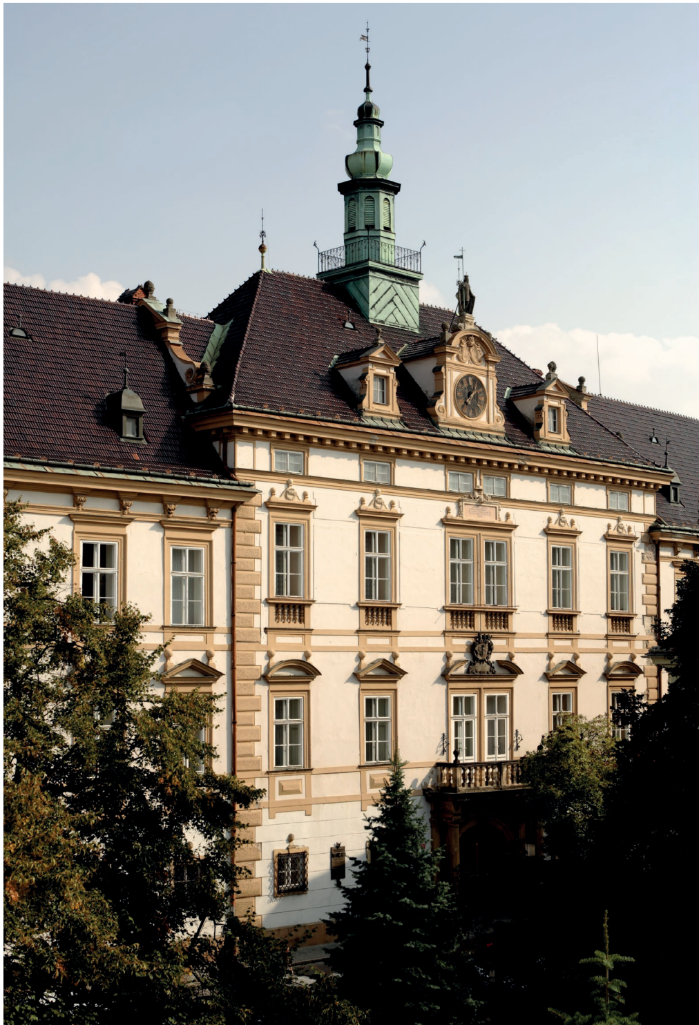
6 Biskupský palác v Olomouci, od roku 1777 palác arcibiskupský, Giovanni Pietro Tencalla, 1666–1672, přestavba 1905.