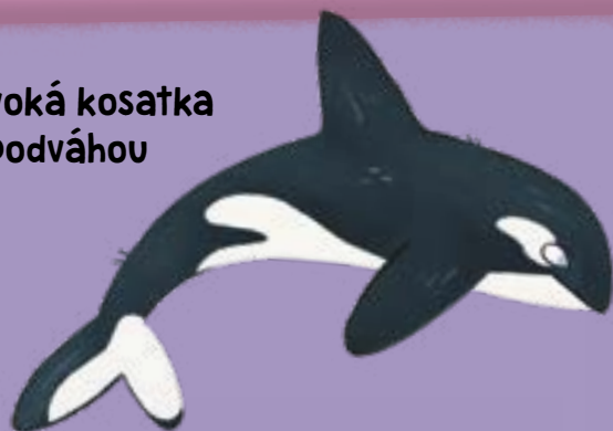
1. Divoká kosatka s podvážou