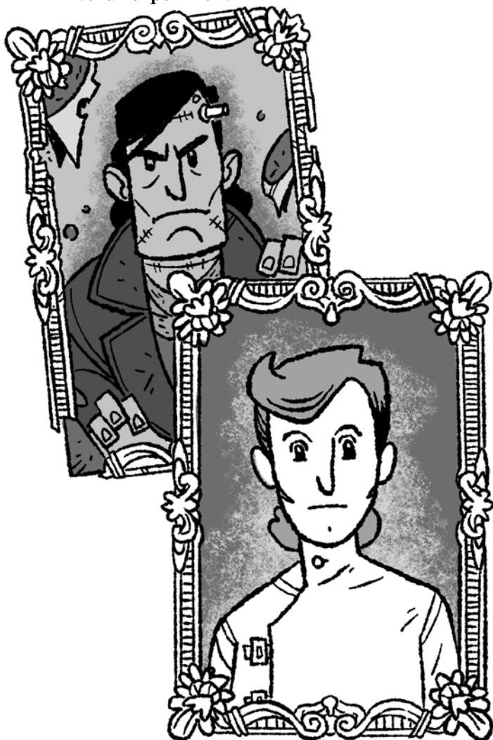
VIKTOR FRANKENSTEIN student přírodních věd