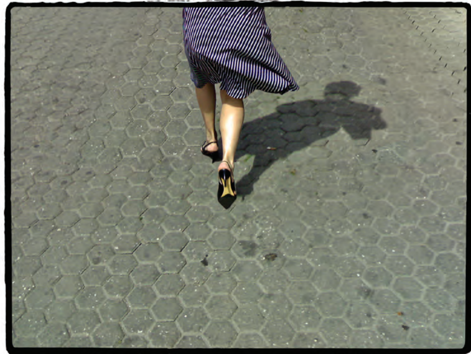
Tylovo náměstí, směr Muzeum