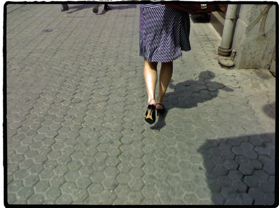
Tylovo náměstí, směr Muzeum